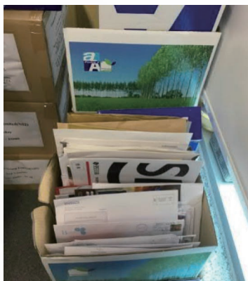
辦公室放置的收集盒

為了減少紙張生產過程對環境的直接及間接影響，我們努力消除打印紙張的需要並創造無紙化工作環境。我們已以網上平台銷售的數碼GO卡取代所有打印GO卡，並逐步由使用打印文件轉向數碼文件。我們亦鼓勵員工重覆使用單面打印的紙張，並減少不必要的打印紙張。辦公室放置有紙品收集盒，以進行回收。節省紙張不僅有助我們減少上文溫室氣體排放一節所述的碳足跡，亦能減輕伐木過程引發的負面影響。