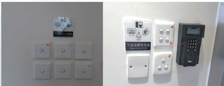
提醒員工在下班前關閉電器的標籤