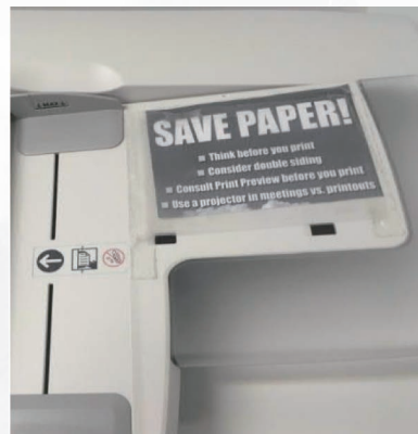
打印機上的節約紙張標籤