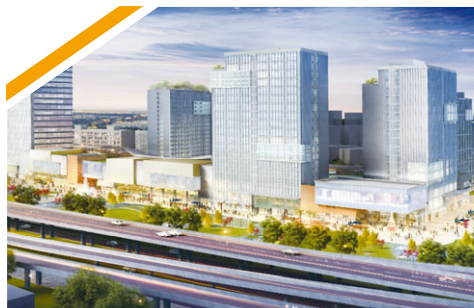
上海寶楊寶龍廣場