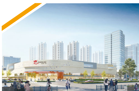
珠海高新寶龍廣場