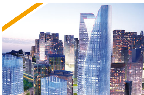
天津濱海寶龍廣場