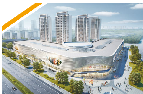
無錫宜興寶龍廣場