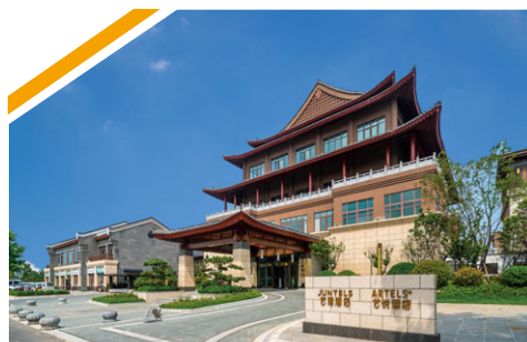
煙台蓬萊藝悅／藝瑤酒店