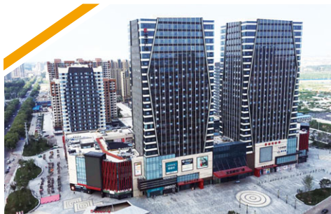
青島膠州寶龍廣場