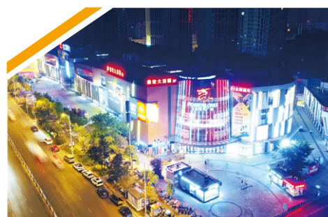
重慶合川寶龍廣場