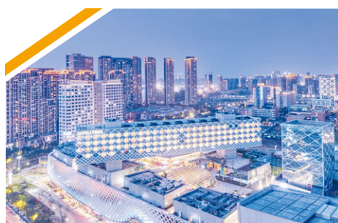
杭州濱江藝瑤酒店