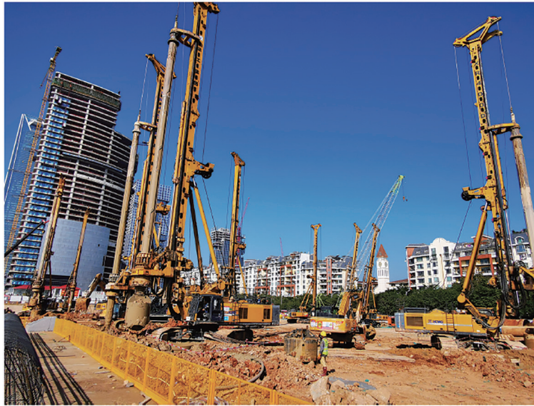
(樁基礎工程項目的施工工地)

我們的專長在於提供專業樁基礎解決方案，使我們能夠攻克需要獨有技術熟練度及適應性的挑戰。我們專攻技術複雜型及大體量型岩土工程項目的承接與實施。