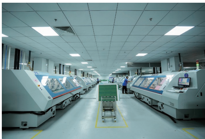
上圖為我們東台工廠的生產區域。

我們的設備支持線寬及線距低至50/50微米，並適用於厚銅及金屬基產品的成品板厚達10毫米。我們持續投資智能製造技術，包括製造執行系統(MES)、集成企業資源規劃(ERP)的流程控制，以及基於統計過程控制(SPC)的良率管理，從而提升整個生產鏈的透明度、效率及可靠性。