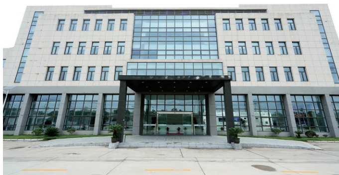
上圖為我們東台工廠的主樓

東台工廠是我們多層PCB、厚銅PCB、金屬基PCB、HDI PCB、高頻/高速PCB、背板及超薄PCB的主要生產基地。該工廠配備先進電鍍、壓合與蝕刻系統，並已通過ISO 9001、ISO 14001、ISO 45001、IATF 16949、QC080000、ISO 50001及ISO 14064等認證，滿足汽車電子及工業控制領域對可靠性與質量的嚴苛要求。東台工廠目前計劃月產能為12.5萬平方米，支持超過約3,000種產品型號，是我們高增值印刷電路板產品產業化的主要平台。