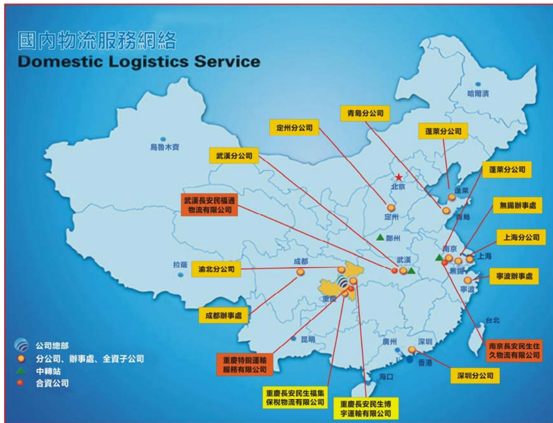
圖二：公司目前的分支機構分佈圖