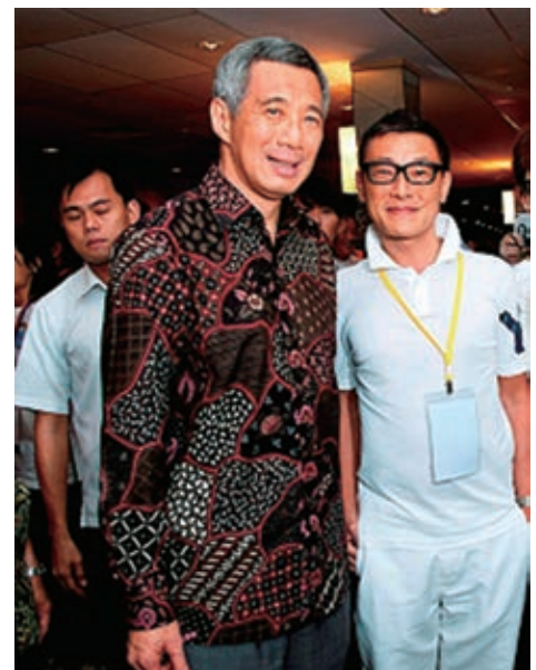
贊助妝藝大遊行2012(新加坡)