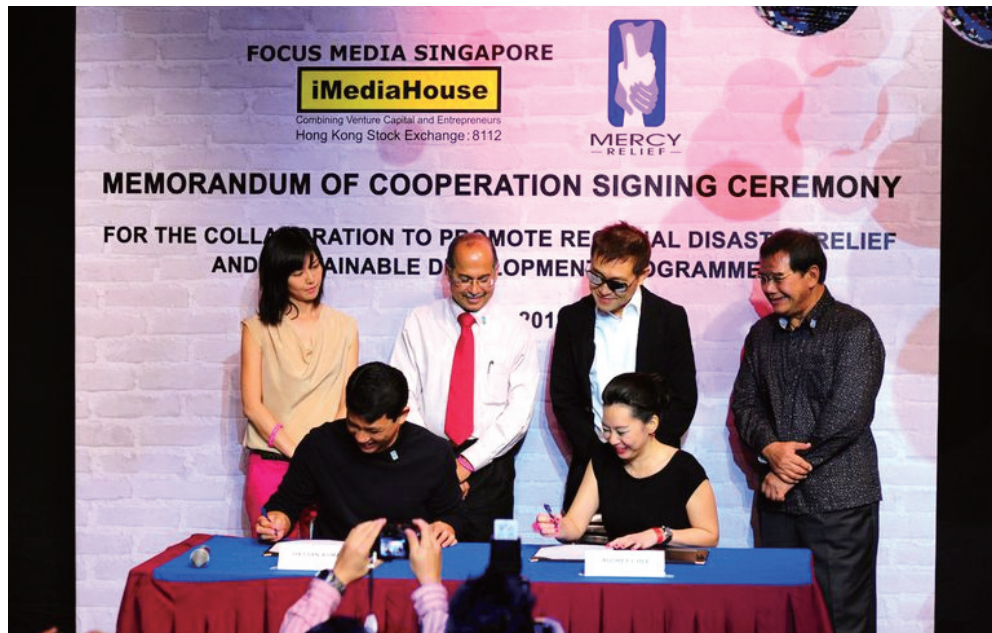
與Mercy Relief合作，支援地區人道及救災，以及可持續發展計劃(新加坡)