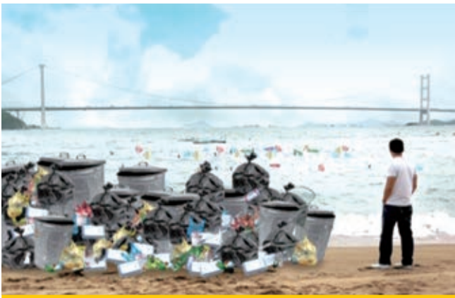
贊助海灘清潔比賽2012(香港)