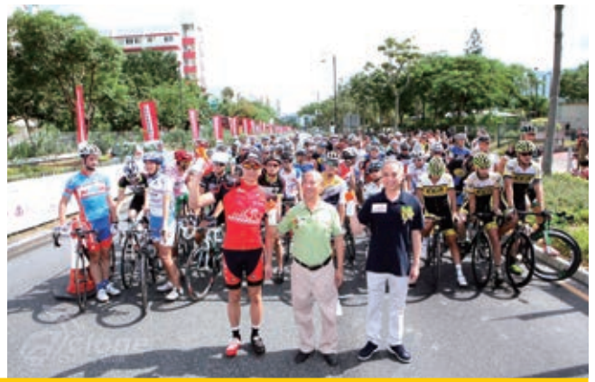
贊助新世界單車慈善錦標賽2012(香港)