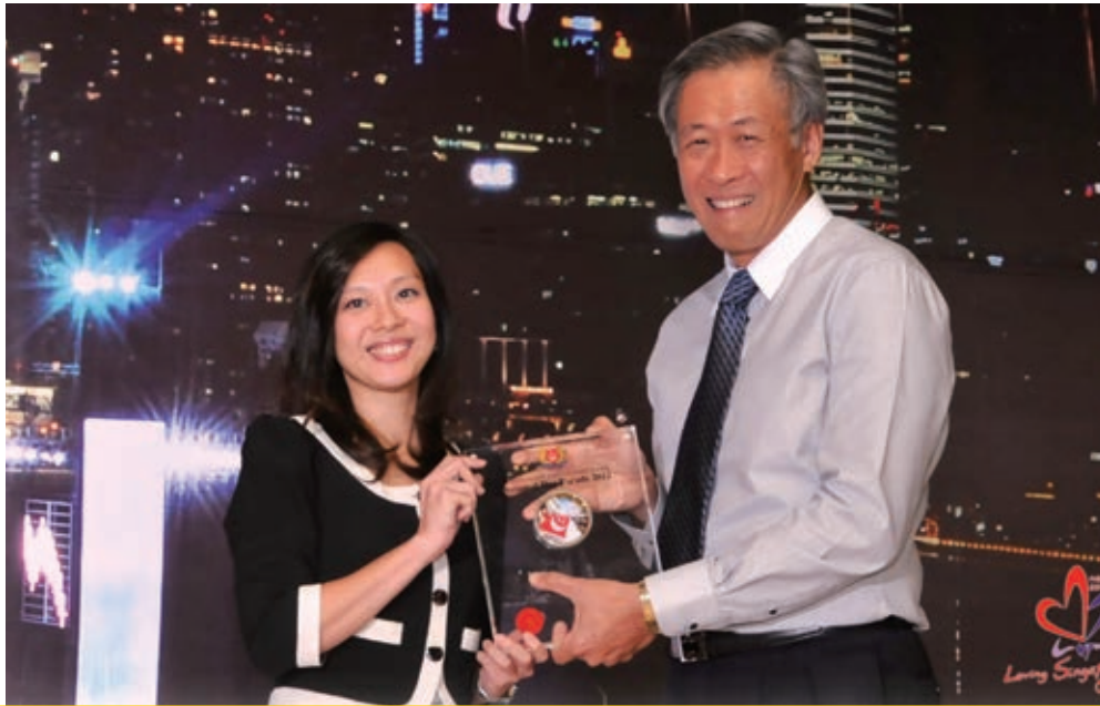
贊助新加坡國慶慶典2012(新加坡)