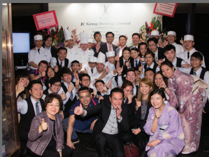
在田舍家舉行慶功宴慶祝成功上市。

於二零一三年十一月二十一日在香港交易所交易大堂舉行開市儀式。該日翻開JC Group歷史上嶄新的一頁。