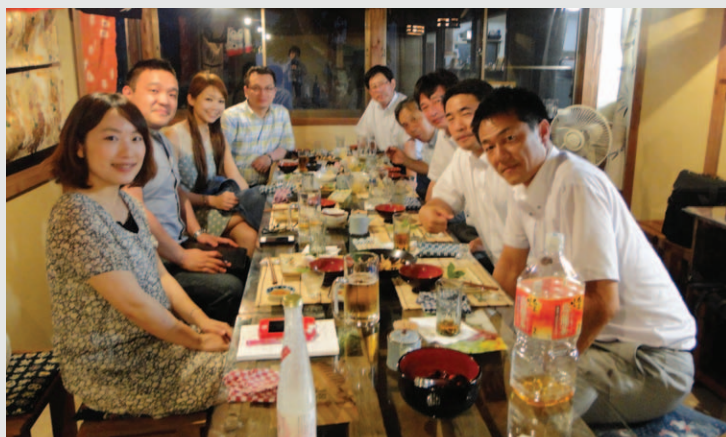
田舍家主廚及公關部代表在日本宮崎。與宮崎農業協會及宮崎傳統舞蹈表演家代表共進晚餐。