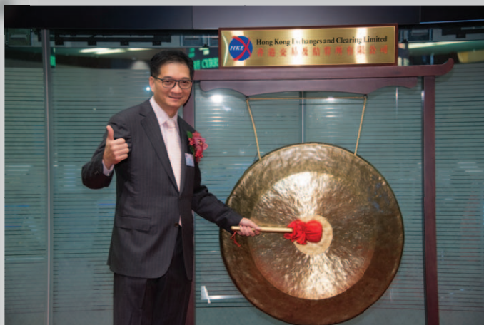
主席胡先生敲「鑼」開始開市儀式。

二零一三年十一月十三日－主席胡先生與行政總裁兼執行董事黃小姐簽署招股章程並隨後遞交予香港聯交所。