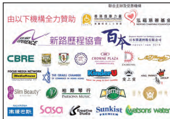
6. 贊助復康力量傷健共融日(香港)