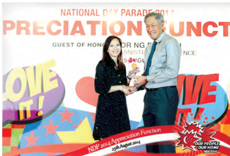
1. 贊助新加坡國慶慶典2014(新加坡)