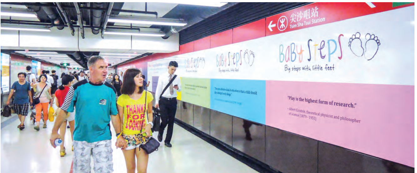
尖沙咀交匯處行人隧道及中間道行人隧道(共三條行人隧道)