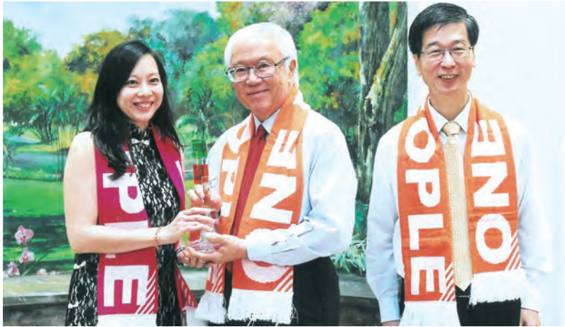
2. 贊助妝藝大遊行2014(新加坡)