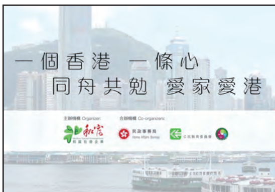
9. 贊助和富社會企業(香港)