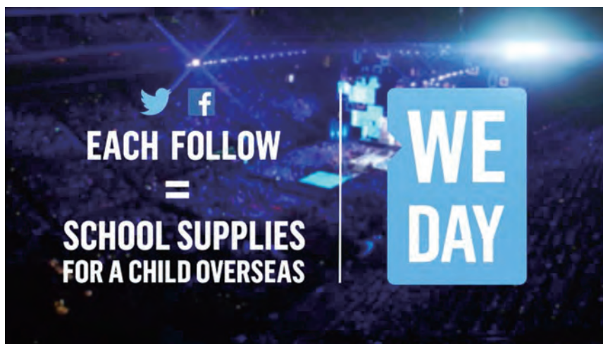
4. 贊助IPG Mediabrands慈善活動—Free the Children (新加坡)