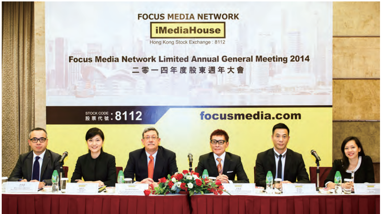
2014年5月股東週年大會