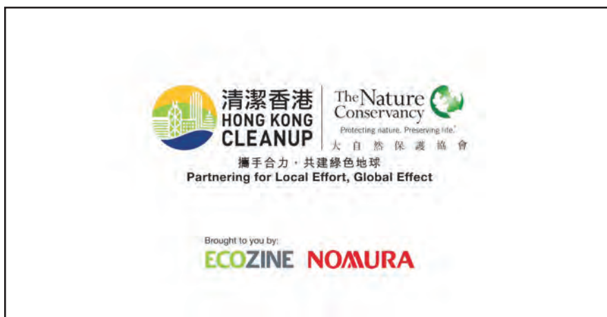
5. 贊助清潔香港(香港)