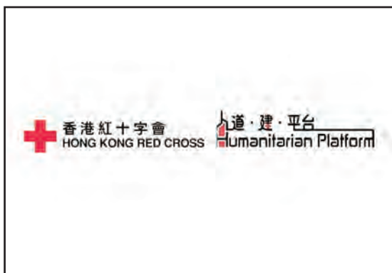
11. 贊助紅十字會(香港)