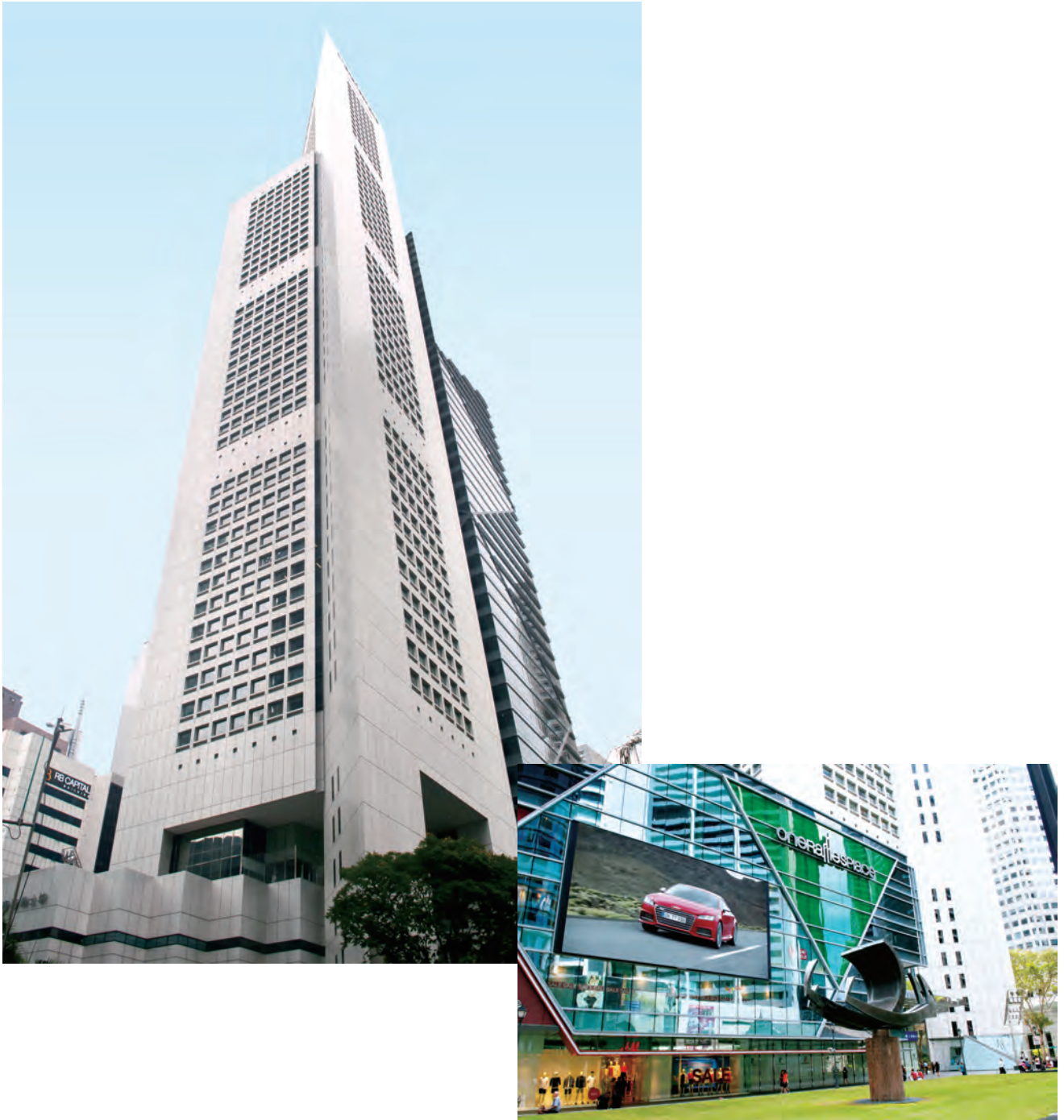
新加坡三大高樓之一——第壹萊佛士坊的LED