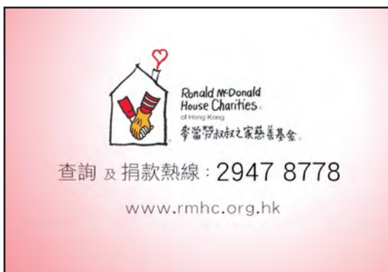
7. 贊助麥當勞叔叔之家慈善基金(香港)