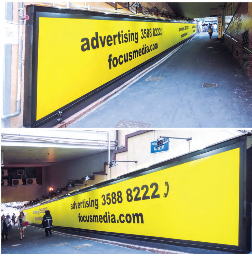
尖沙咀諾士佛臺廣告牌