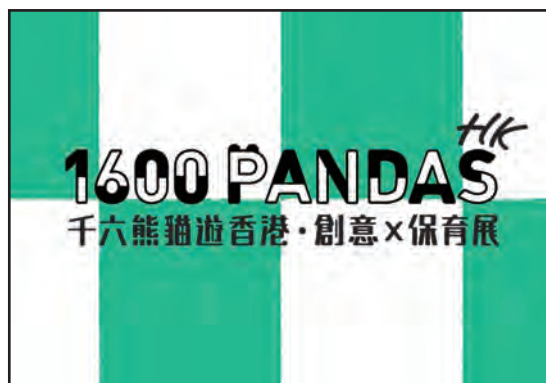
10. 贊助千六熊貓遊香港·創意x保育展(香港)