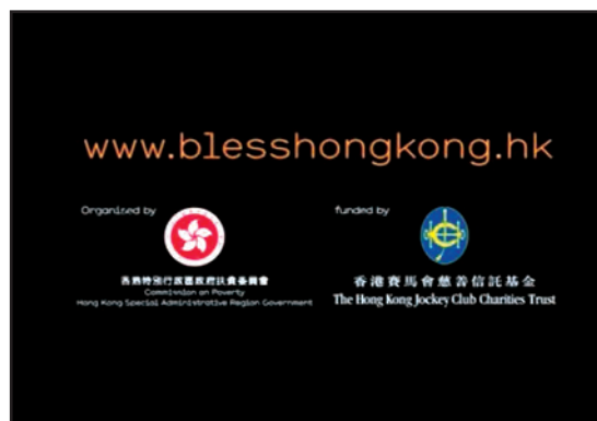
8. 贊助築福香港(香港)