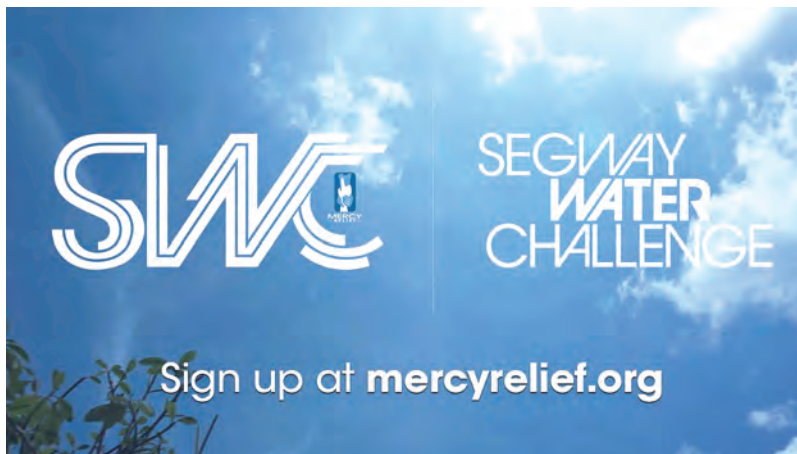
3. 與Mercy Relief合作，支援Segway Water Challenge(新加坡)