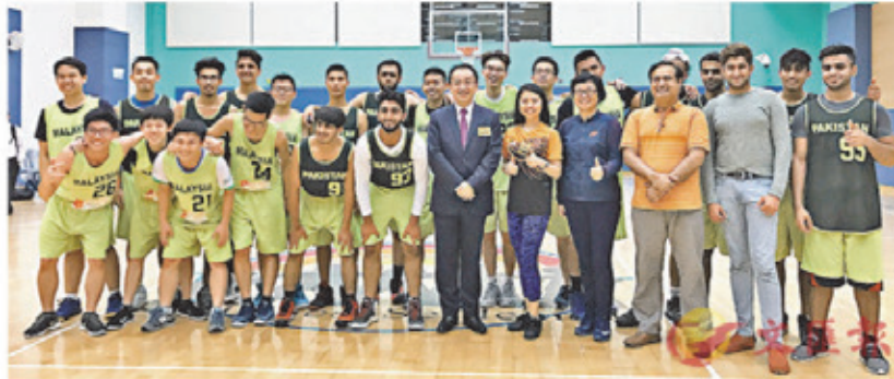
■香港「帶路」籃球友誼賽開幕。

香港文匯報訊（記者 子京）由絲綢之路經濟發展研究中心、博亞體育、人民香港有限公司共同主辦，凱順能源有限公司、香港能源礦產聯合會、馬來西亞駐港澳商會贊助的「一帶一路」籃球友誼聯賽，4月7日晚在灣仔拉開序幕。