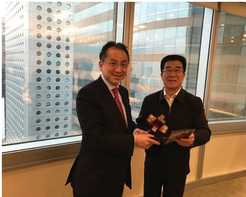
凱順能源集團董事局主席陳立基先生會見來訪山東省棗莊市李峰市長，共商棗莊地區於「一帶一路」之發展契機