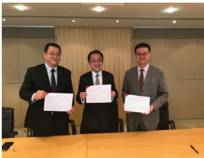
凱順能源與DKKK及越南生產商簽訂合作諒解備忘錄