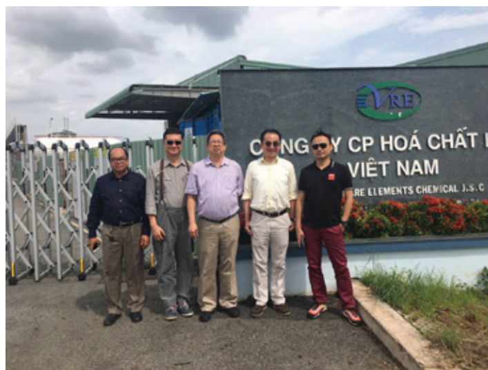
凱順能源團隊及商業夥伴參觀越南工廠