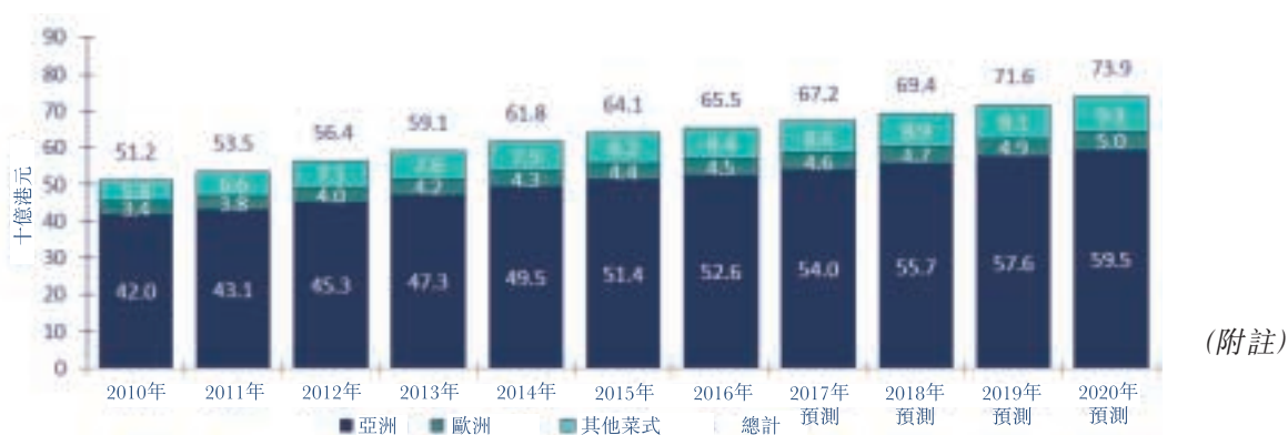
2010年至2020年香港獨立全服務式餐廳行業的收益 (2010年至2016年的過往收益及2017年至2020年的預測數字)

附註：上述預測乃基於(i)行業收益總額的過往趨勢及增長勢頭；(ii)餐廳數目的過往趨勢及增長勢頭；(iii)業內從業人員的過往趨勢及增長勢頭；(iv)過往消費物價指數增長率、租金及工資增幅；及(v)香港本地生產總值增長率的預測而作出。