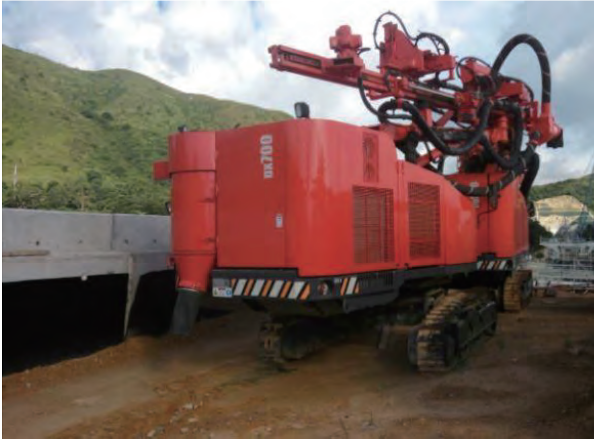
DX Ranger DX700

我們的地盤設備相對較新。截至二零一七年七月三十一日，我們地盤設備(包括我們購入的已翻新地盤設備)的平均機齡為0.96年。有關設備的運作一般更具效率，且維修費用一般較低。董事認為，擁有自置地盤設備讓我們可制訂合適的工程時間表及方法，配合不同客戶的不同需求及要求，並使我們可高效及有效地安排項目及調配資源。