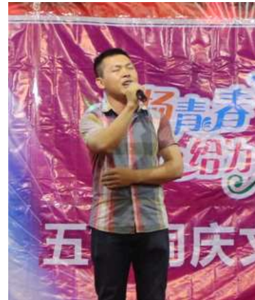
聚會當天天氣良好，加上令人興奮的娛樂表演，整個聚會完滿舉辦。