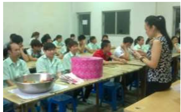
員工在生日聚會享受蛋糕和點心。

為了向員工展示公司對他們的關懷，我們定期舉辦生日派對，讓員工在工作時間內享受蛋糕和點心，以表達公司對他們服務的感謝之情。