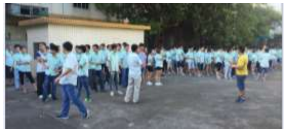
我們在東莞進行的滅火器操作和防火演習。

除了培訓之外，維護消防安全設備的功能性也非常重要，包括應急照明和自動噴水滅火系統。作為基準，我們每月都會對營運地裡的所有消防安全設備進行檢查，為設備的狀況作妥善而詳細記錄。於報告期內，公司在佛岡工廠裡沒有發現有火災隱患的設備。至於東莞，自 2017 年 7 月起，本集團開始聘請專業的消防安全工程公司來維護我們的消防安全系統，此舉可對未來給予更大的安全保證。