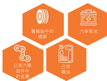
圖三 於二零一七年實行的回收計劃

於二零一七年，本集團實行若干新計劃以減少廢棄物，乃主要透過回收舊有物料。例如，收集舊輪胎中的橡膠並出售予回收公司，以產生額外收益，從而用於處理廢棄物管理工作。