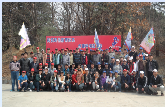
組織員工拓展訓練，培養團隊合作力