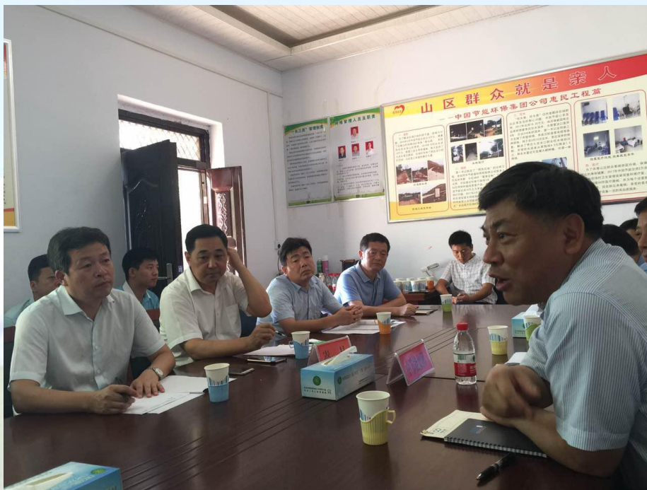
公司在中節能支持下參與嵩縣扶貧會議