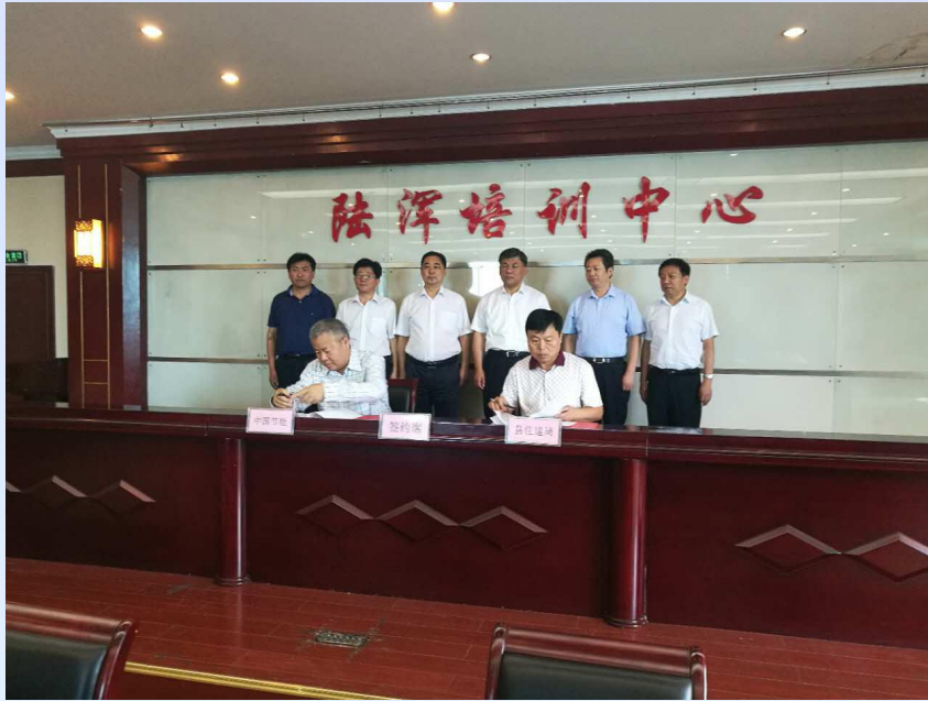
公司與嵩縣城建局簽訂“三館”工程地能供暖項目合作協議