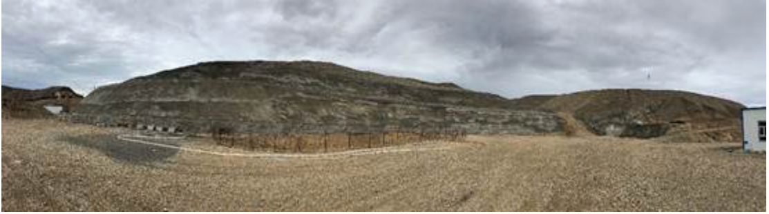
新疆吐魯番之星亮礦