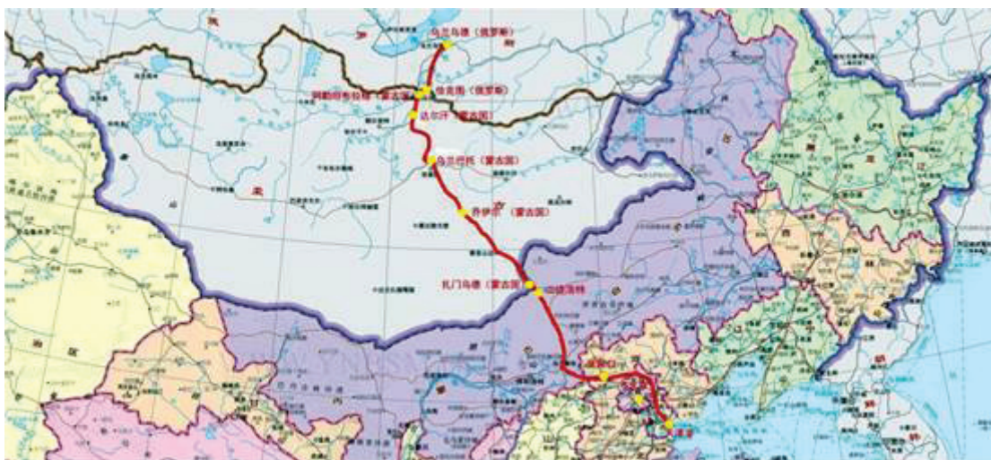
俄蒙中三國的沿線物流