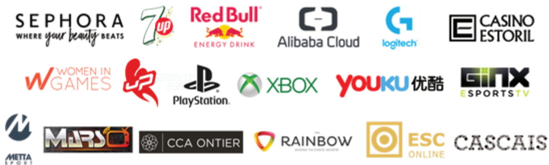
▲2018年女子電競嘉年華合作夥伴

這些全新數據加上像絲芙蘭，7up和Logitech等合作夥伴的加入(請參閱我們的中期報告瞭解更多詳情)，證明了Girl Gamer這一品牌正在迅速收穫來自全世界電競產業的認可與口碑。