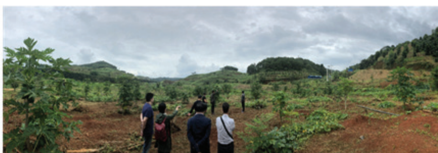
凱順團隊到地方政府及農地實地視察