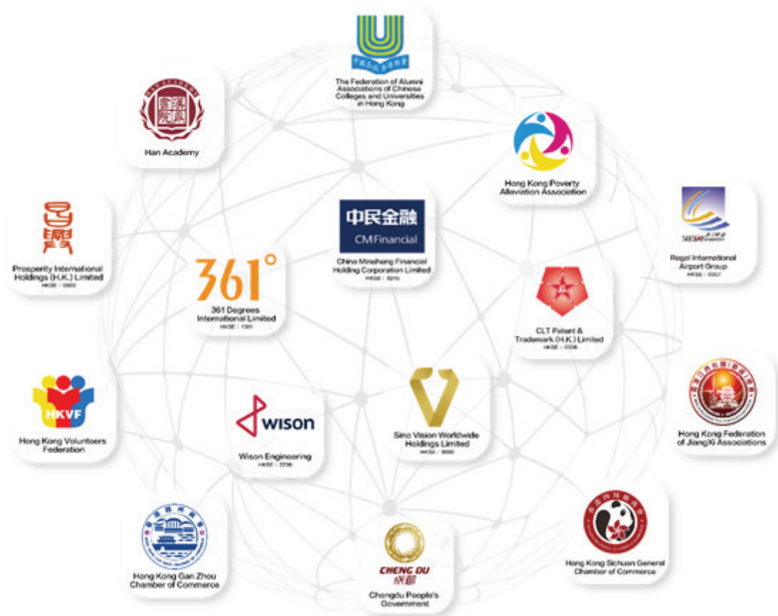
▲ 人民香港現有客戶

傳統招商及上市公司品牌顧問業務並駕齊驅，同時也廣泛鏈接香港社團及非牟利機構，獲得更多資訊及機遇。