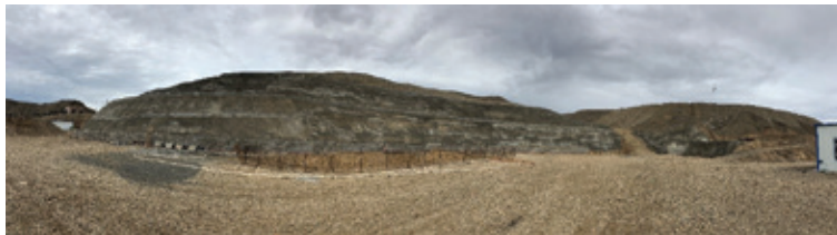
新疆吐魯番之星亮礦