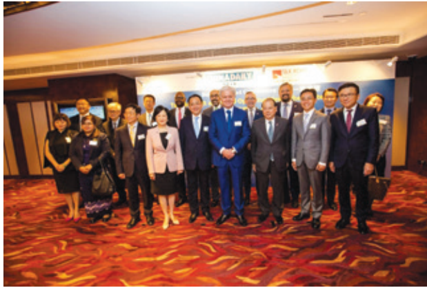
▲ 右1： 陳家強先生，香港特別行政區前財經事務及庫務局局長，香港科技大學工商管理學院兼任教授

作為贊助機構，凱順相信香港位處能為大灣區及一帶一路提供拓展新機遇之地理位置。出席論壇人士透過與各嘉賓討論及交流，共同探討大灣區內及一帶一路之潛在機遇。