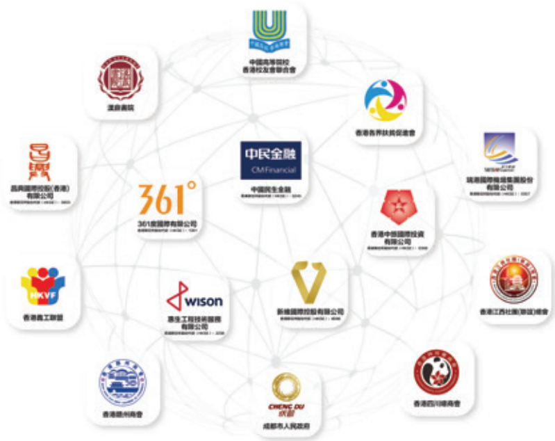
▲人民香港現有客戶

傳統招商及上市公司品牌顧問業務並駕齊驅，同時也廣泛鏈接香港社團及非牟利機構，獲得更多資訊及機遇。