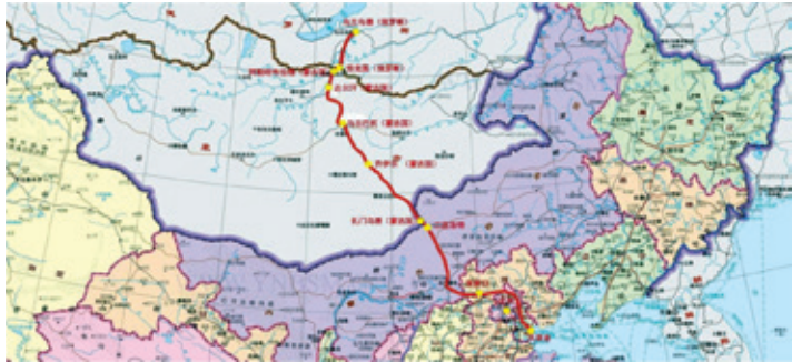
俄蒙中三國的沿線物流