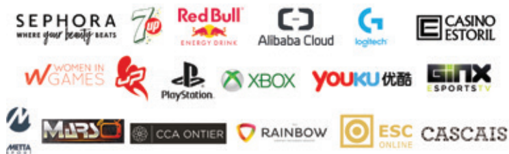
▲2018年女子電競嘉年華合作夥伴

這些全新數據加上像絲芙蘭，7up和Logitech等合作夥伴的加入(請參閱我們的中期報告瞭解更多詳情)，證明了Girl Gamer這一品牌正在迅速收穫來自全世界電競產業的認可與口碑。