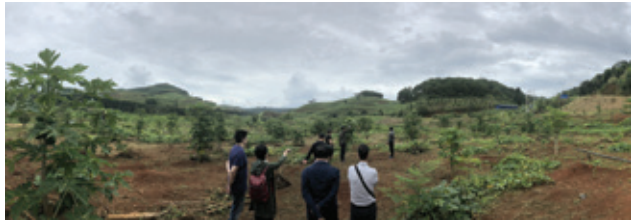
凱順團隊到地方政府及農地實地視察