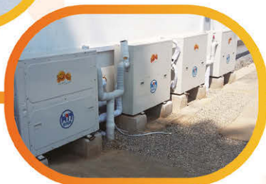
農村自採暖地能熱寶系統應用外景