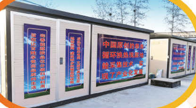
高效電替煤集中供暖機房