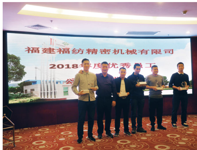
年度傑出員工獎頒獎典禮

本集團為所有員工提供並根據相關國家勞動法律法規(例如：《中華人民共和國勞動法》和《中華人民共和國勞動合同法》)制定具吸引力的薪酬待遇。如我們的人力資源管理程序和員工手冊所述，全職僱員的薪酬和福利包括工資、年假、婚假、產假，待產假和喪假、津貼，加班費和社會保險等。本集團會定期檢討員工薪酬，並以當地同行的行業慣例為基準進行調整，以確保員工獲得符合最新市場趨勢的獎勵。為了激勵我們的員工，本集團給獎金予績效良好的員工。此外，我們通過選舉和頒發年度優秀員工獎勵來激勵員工，以表達我們對員工貢獻和成就的讚賞。