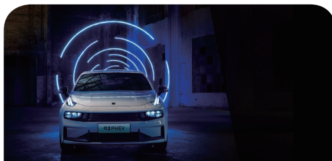
Lynk 03 PHEV