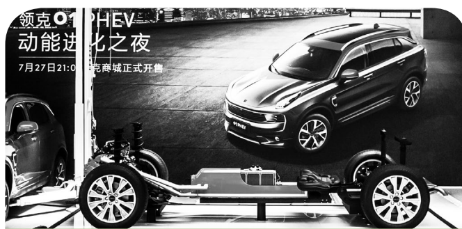
Lynk 01 PHEV的電池包由浙江衡遠新能源生產

本集團持股52%之附屬公司浙江衡遠新能源是位於金華新能源汽車產業園的一個集研發、生產、檢測及檢驗、展示及服務、銷售鋰離子電池及電池系統為一體之現代化鋰離子電池企業。浙江衡遠新能源佔地約130,000平方米，廠房最大的設計產能每年可生產約2,000,000千瓦時三元鋰離子電池。首條500,000千瓦時的生產線自二零一八年第二季起已開始量產。該全自動生產線採用了頂尖的設計及技術來製造軟包電池。新生產線的安裝時間將視市場需求情況及發展策略而定。