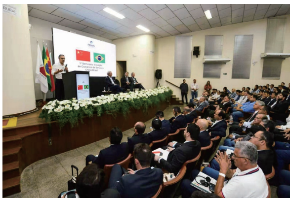
於Montes Claros舉行的首屆中國巴西服務貿易創新研討會

二零一九年九月十二日，SAM和中華人民共和國駐里約熱內盧總領館在Montes Claros市共同舉辦了「首屆中國巴西服務貿易創新研討會」，Montes Claros是米納斯州北部最大的城市，靠近八號區塊項目。米納斯州州長Romeu Zema、里約總領館總領事李揚、徐元勝商務參贊、以及約28家中資機構／公司，如國家開發銀行、國家電網、華為、中信建設、中國電建、三峽集團、中廣核以及中鋼集團等參加了本次研討會。SAM公司執行總裁做了「八號區塊項目 — 發展及服務貿易促進平台」的主題介紹。在研討會上，SAM宣佈了其計劃將採用5G技術用於露天坑無人開採，以及鑒於項目區域是巴西太陽能、風能和生物質能潛力最豐富的區域，在項目投產5年後將最終使用100%可再生能源為項目供電。