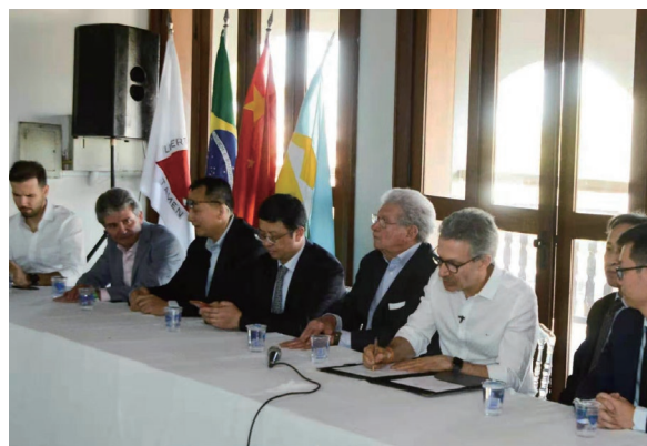
諒解備忘錄簽署儀式