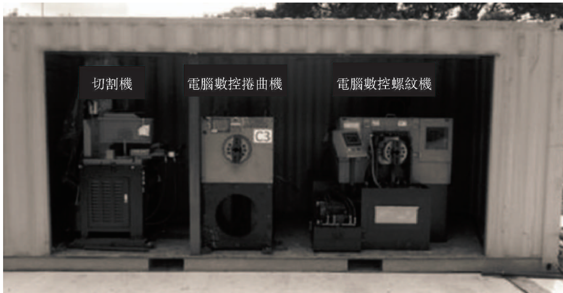
位於車間的三種機械鋼筋並接機

本集團車間消耗的電力為溫室氣體排放的最主要來源。大量電力消耗的原因在於車間用於提供機械鋼筋並接服務的機器的運作，即切割機、電腦數控捲曲機及電腦數控螺紋機，該等機器乃由電力驅動。