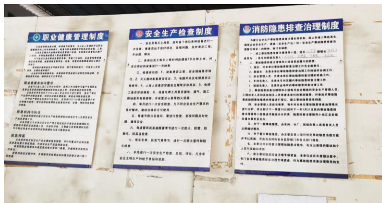
圖表3.工廠內之安全要求和操作守則