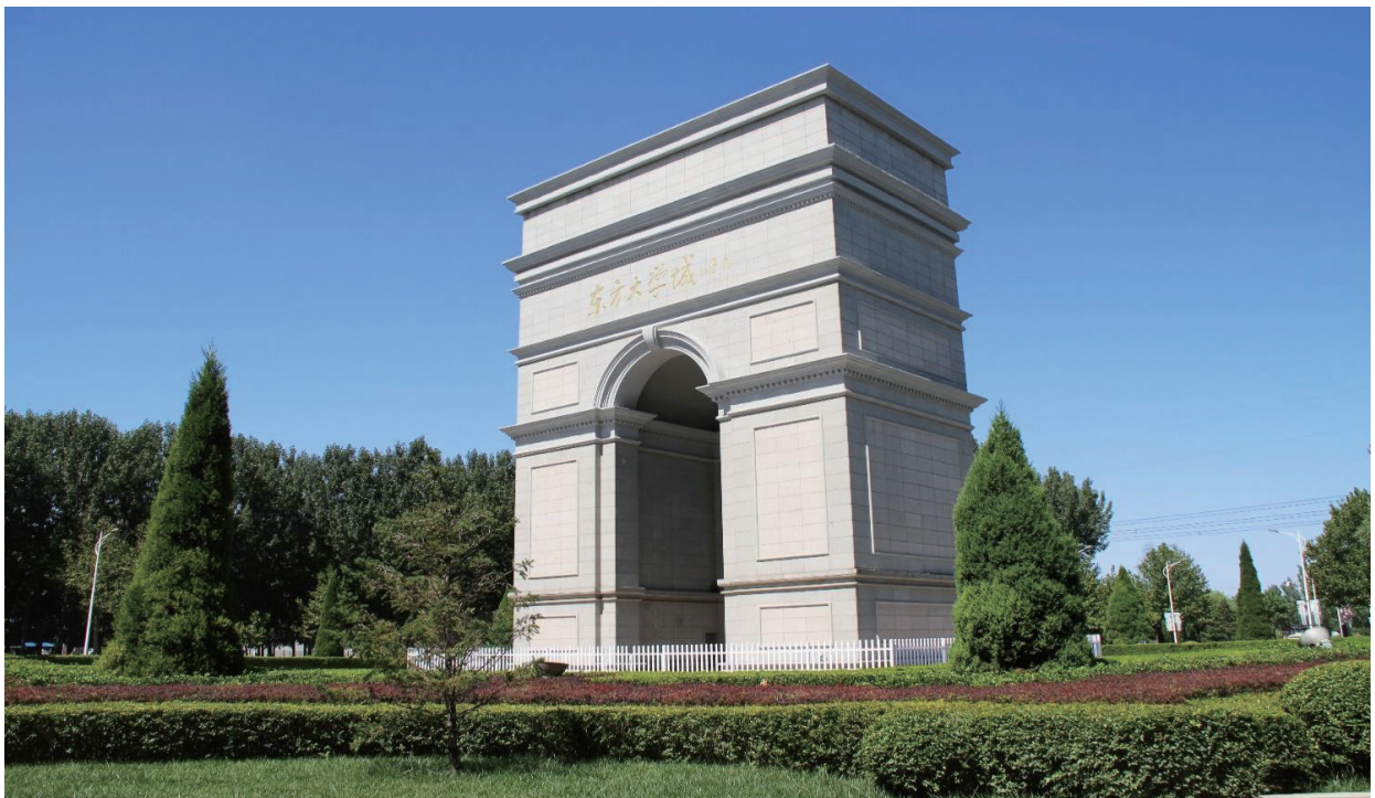
位於東方大學城的凱旋門

東方大學城控股(香港)有限公司(「本公司」，連同其附屬公司，統稱為「本集團」)發出截至二零二零年六月三十日止年度環境、社會及管治報告(「環境、社會及管治報告」)，當中涵蓋本集團的環境及社會方面的信息以展示其對可持續發展的持續投入。有關本集團企業管治及財務報表的其他資料可參閱二零二零年本年報。