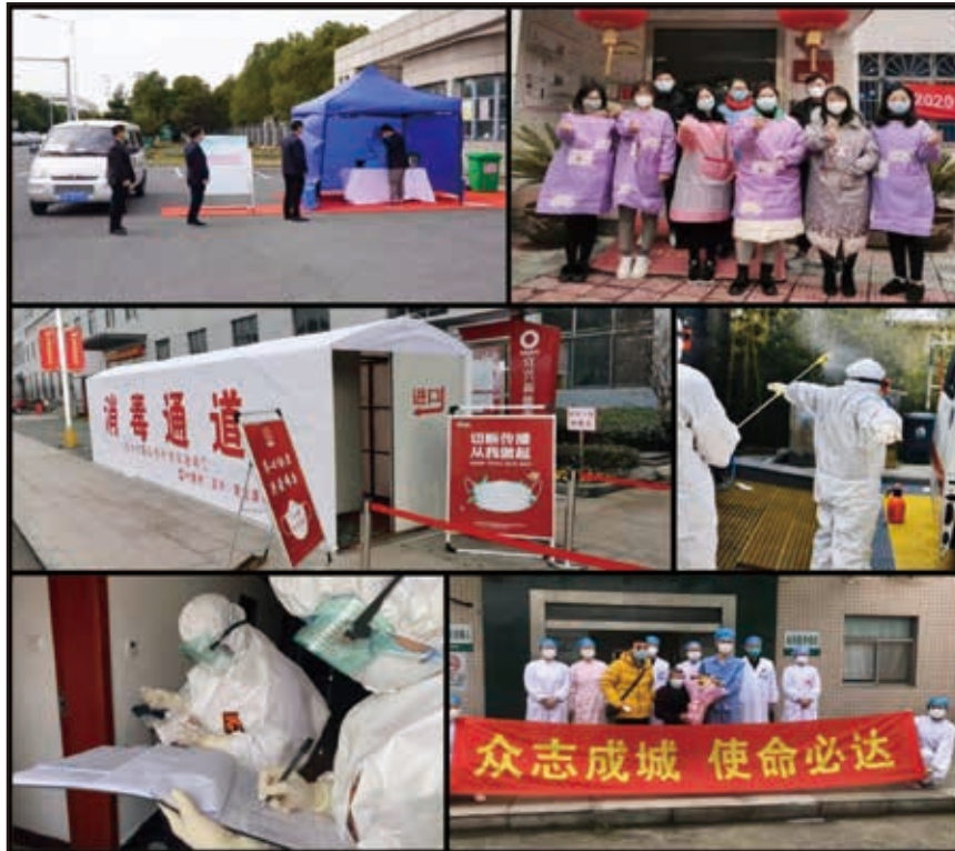
我們協助當地政府營運新型冠狀病毒檢測中心，並實施防疫措施

抗擊新型冠狀病毒疫情為本集團社會關懷一環。我們積極與當地政府及非營利組織合作組織並參與各種慈善活動及社會福利行動，致力打造更美好的社會。展望未來，我們將繼續積極投身於社區活動，不遺餘力地幫助當地社區和有需要的人。我們亦將繼續鼓勵員工積極參與志願服務，攜手在我們賴以生存的社區傳播服務精神。