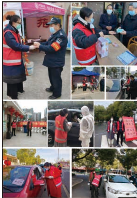
我們在社區參與實施衛生管控及防疫措施的情況

為與社會各界共同抵禦新型冠狀病毒的傳播，本集團承諾於二零二零年年初至年中，自願派員協助宜興市政府營運新型冠狀病毒檢測中心；向被封鎖隔離的指定居民區運送日常用品；及在社區內實施一般衛生控制和防疫措施。