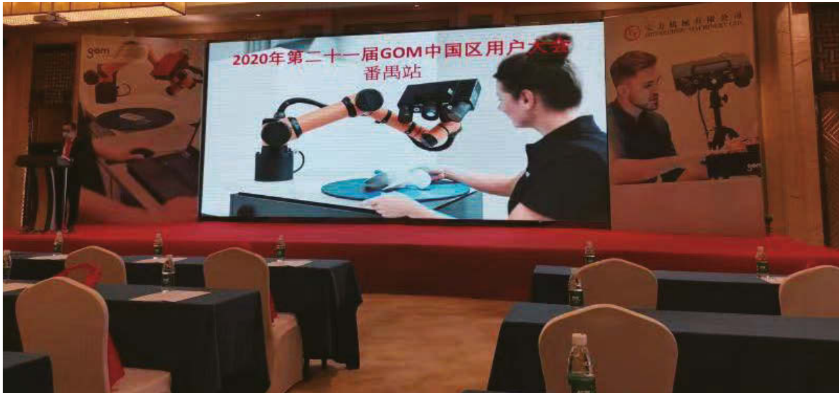
為供應商舉行貿易博覽會