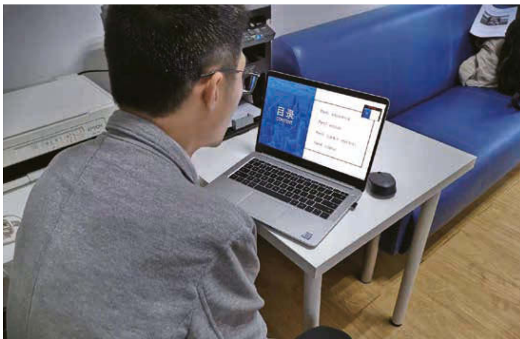
團體醫保線上培訓