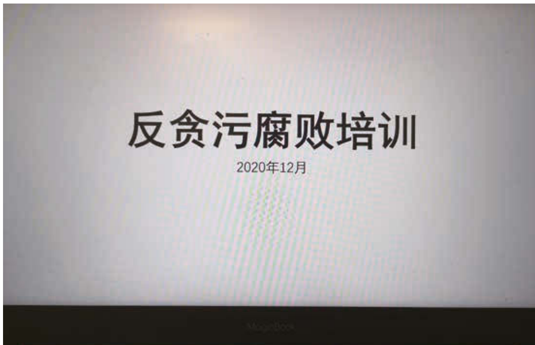
反賄賂及貪污培訓

我們關懷員工，深信和諧的僱傭關係有利本集團的穩定發展。我們每年對員工進行考核，評估其工作表現及培訓需求，使其更佳了解自身的優勢，並按所追求的事業目標視察相關進度。我們力求讓員工的潛力得到充分發揮，並確保其在專業發展上的努力付出獲得理想的回報。