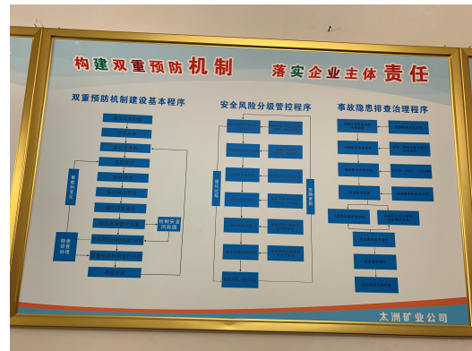
於礦山的事故預防、安全風險分級及 事故隱患排查治理程序