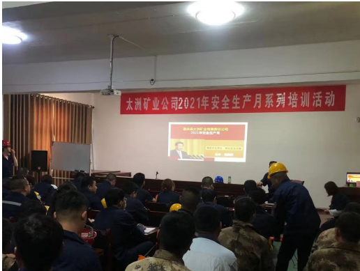
安全生產培訓活動(圖1)

貴集團提供了不同的內部培訓以培訓員工，包括對新員工的入職培訓和在職培訓以令員工有效地適應 貴集團的運作和鞏固工作上所需要的技能以及知識。僱員應安全工作、遵守安全工作流程並謹慎操作機器及設備。