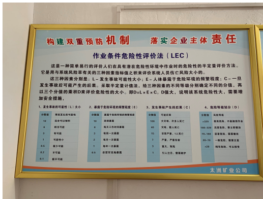
於礦山的作業條件危險評價辦法