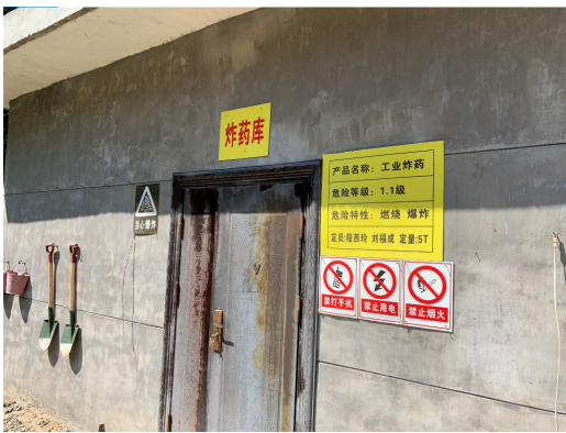
炸藥庫外的安全設備

貴集團使用炸藥開採金礦物，並嚴格遵守與中國標準貫徹一致的炸藥使用規則及法規。貴集團設有經安全機構及控制物資的地方公安機關批准並根據其規定標準設計的專門、專用及隔離的炸藥庫。雷管及炸藥存放於兩個獨立的庫內，彼此之間存有安全距離。該等庫房所在的院落完全被高牆、金屬門及24小時監控攝像頭護衛。兩間炸藥庫均各有兩把鎖、鎖匙由兩名獨立員工（一名管理人員及一名安全人員）保管。僅於該兩名人員（鎖匙保管人）同時出現方能完全打開全部門鎖，才可以取得雷管及／或炸藥。存儲設施由管理層以及安全及公安機關定期檢查，以確保始終合規。使用炸藥後，貴集團將使用檢測設備測量空氣殘餘物數量，待空氣符合標準後方會安排僱員進入金礦。