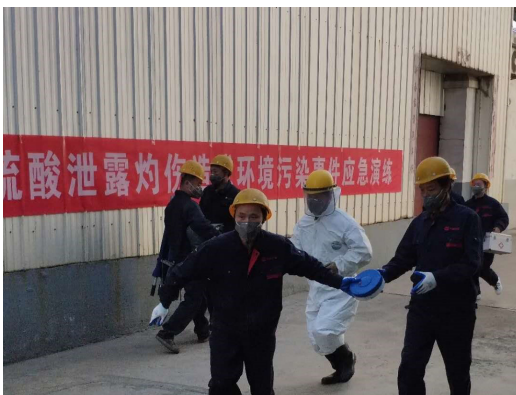
化學品泄漏應急演練活動(圖3)