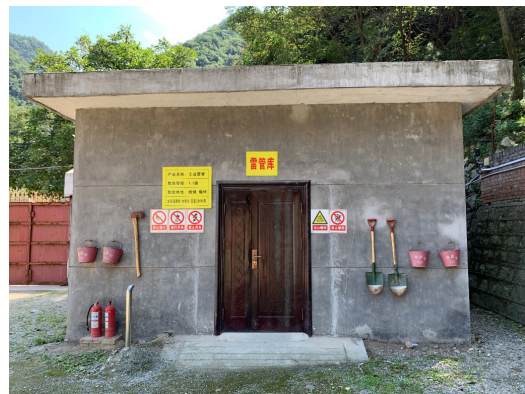
雷管庫外的安全設備