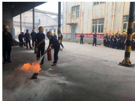
消防應急演練活動(圖4)

貴集團不時評估培訓課程並審閱培訓效果。 貴集團致力於提升僱員的知識及技能以便於工作職責的履行。