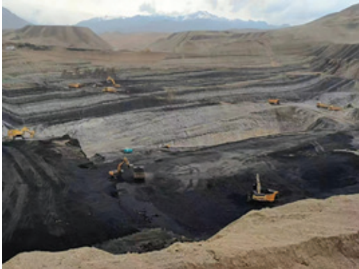
施工團隊進行挖土及撥離工作