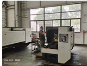
滕州凱源的日常營運情況