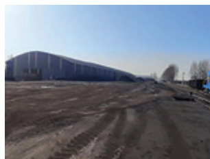
山東凱萊的日常營運情況