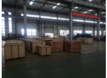
滕州凱源的日常營運情況