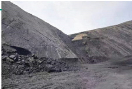
星亮礦的日常營運情況