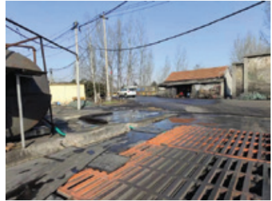
環保建設 — 興建大棚工程