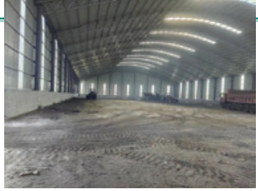
山東凱萊的日常營運情況