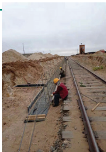
喬伊爾項目的建設工程進度