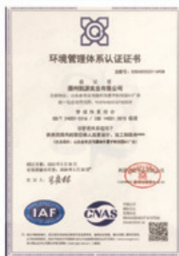
2023年新獲得的歐標證書