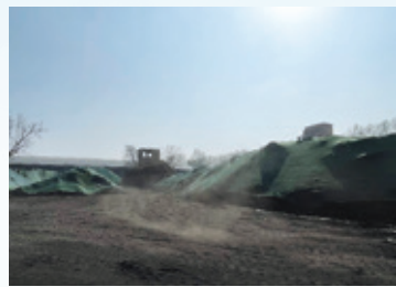
山東凱萊的日常營運情況