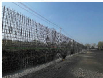
山東凱萊加建圍牆工程