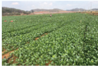
雲南蔬菜種植基地