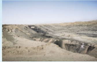
施工團隊進行勘探工程