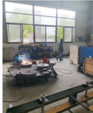
滕州凱源的日常營運情況