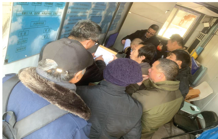
(上圖為組織供暖機房培訓)

彙報上述受訓率及平均受訓時數的方法主要是基於聯交所發出的《如何編備環境、社會及管治報告》—附錄三：社會關鍵績效指標匯報指引。