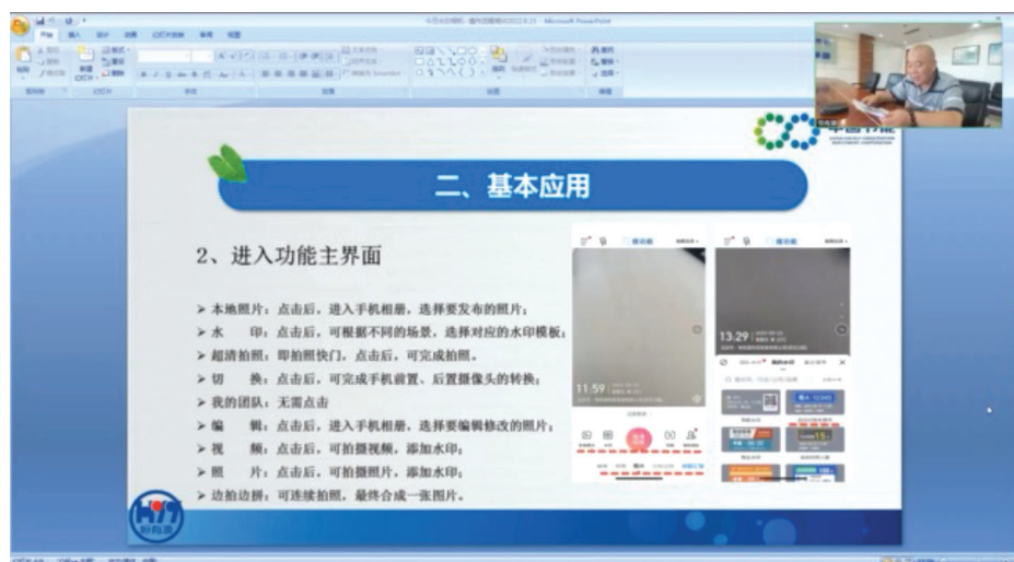
(上圖為組織線上應用軟體操作培訓)