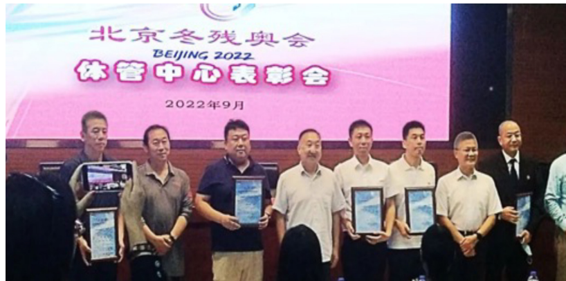
本集團代表出席北京2022年冬奧會和冬殘奧會的表揚會

2022年9月9日在中國殘疾人體育運動管理中心報告廳，舉行了“北京冬殘奧表彰會”。本集團子公司作為供暖運營保障單位接受了表彰，並對本集團子公司在舉世矚目的北京2022年冬奧會和冬殘奧會為一系列場館提供的供暖安全運行保障給予高度評價，也對本集團派出的現場工作人員給予表揚。