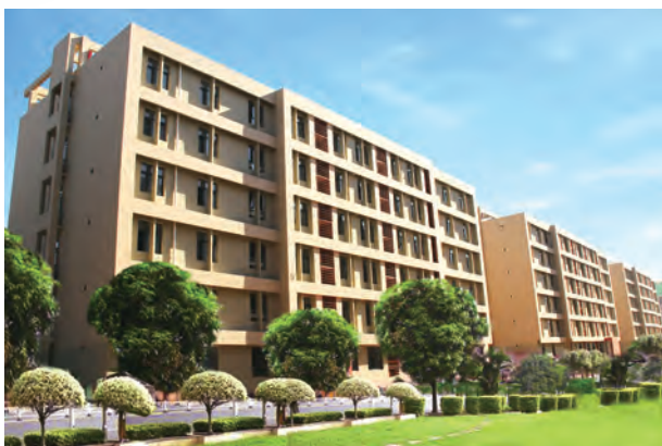
▲ 校園場地的環境改善

本集團委聘園藝服務供應商在校區提供園藝服務，包括清除任何雜草或枯萎植物，並種植新苗圃及茁壯植物。園藝服務供應商必須遵循本集團的《綠化養護方案》內部指引、《綠化養護操作規範》及《綠化養護質量與考核標準》，其中訂明各類植物的施肥周期，以及修剪樹木、清除枯萎植物及噴灑防蟲劑等指引。