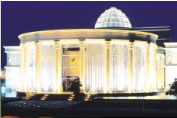
黃埔雅苑以「培育新世代」為主題的高級會所，為住戶家庭成員提供各式俱備的設施。