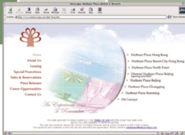
海逸酒店集團的網頁全面介紹屬下酒店業務概況。網站內尚包括香港、北京、重慶、昆明和巴哈馬群島的酒店簡介。

益)。四季雅苑餘下之工程預計於二〇〇一年及二〇〇二年分期完成，提供八十萬平方呎之別墅及多層式住宅。另外，集團又在附近參與發展一幅地皮（集團佔百分之三十一權益），在未來六年分期興建一百七十萬平方呎之別墅及多層式住宅。集團也在徐匯區參與住宅發展項目華爾登廣場（集團佔百分之四十二點五權益）。該項目之樓面面積將達一百六十萬平方呎，目前進度理想，預計於二〇〇四年竣工。