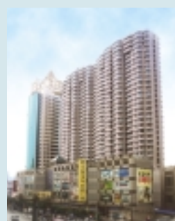
不夜城廣場 上海市閘北區