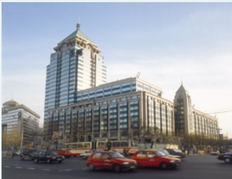
恒基中心 — 北京市東城區