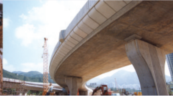
馬鞍山發展工程第三期（合約S之完成合約）－ 在第77及86區進行平整地盤、築路及渠務工程

境，使會員能夠舒適地享受晚年之黃金歲月。俱樂部不僅可作為退休人士之永久居所或渡假中心，亦附設多項設施，照顧會員日常及社交需要，力求會員與社會保持緊密聯繫。