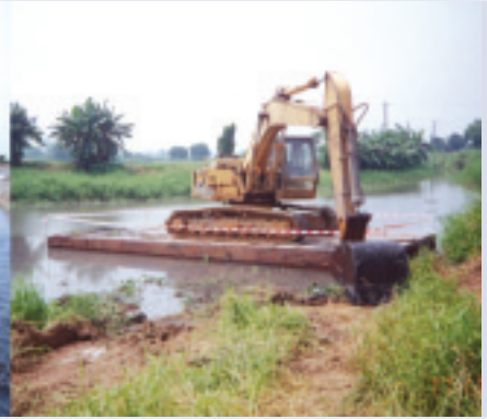
新界區清理水道淤泥工程及 根據土地排水條例進行之配套工程

政府進一步改善新界西北區內之環境及水浸情況，以及為區內居民提供舒適安全之居住環境。