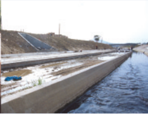
元朗及錦田區主渠第二期建造工程 由錦田新村至橫合山一段