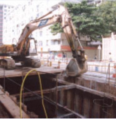
西北九龍排污工程第二期第三階段及 西九龍排水渠改善工程第一階段 荔枝角、長沙灣及深水埗區