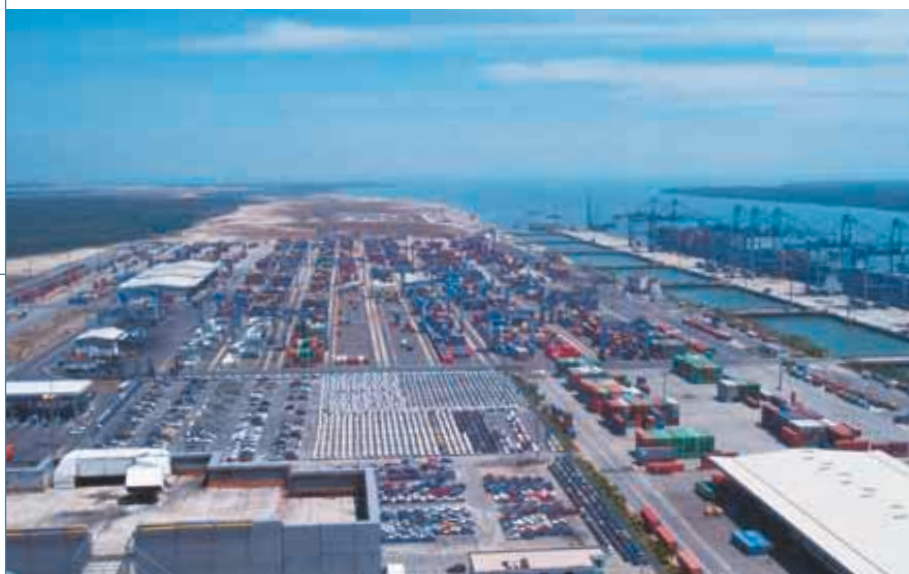
馬來西亞巴生西港配備先進設備,可以處理貨櫃、散裝乾貨、散裝液體貨物以及傳統貨物。

集團於二〇〇〇年九月在馬來西亞收購巴生西港(集團佔百分之三十一點五權益)。該碼頭於收購後之吞吐量若化作全年計算,較上年度增加百分之三十九,而利息及稅前盈利亦有相應之增幅。