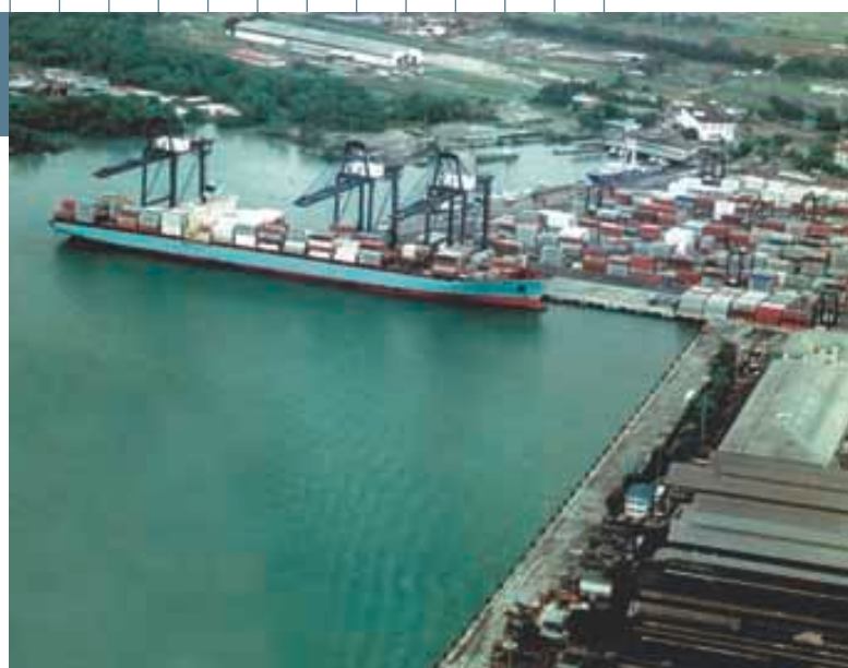
巴爾博亞港專為跨越太平洋區的貿易提供服務。

集團於去年之六月交易中亦收購在墨西哥及阿根廷之四個營運中之碼頭。該四個碼頭合計有六個泊位，年處理能力共達一百五十萬個標準貨櫃。集團並持有認購期權，可於二〇〇二年認購該等碼頭之額外權益。於二〇〇一年第四季度，集團增加在墨西哥維拉克魯斯國際碼頭之投資，使所佔權益由百分之三十二增至百分之八十二。各新收購之碼頭資料如下：