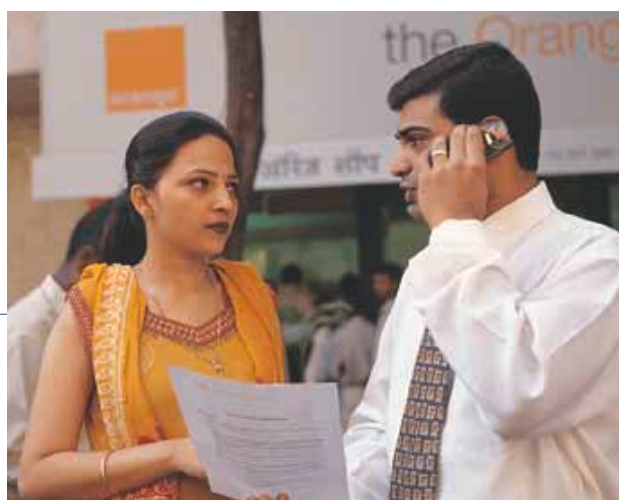
流動電話在印度日趨流行。目前全國有六百多萬名流動電話用戶，每月增長率超過百分之五。

在印度，集團擁有四項2G電訊業務的百分之四十九權益，包括：孟買的Hutchison Max Telecom、德里的Sterling Cellular、加爾各答的Usha Martin Telekom及古吉拉特邦的Fascel。於二〇〇一年下半年，集團與Essar Group組成之合資公司投得額外三個流動通訊牌照，總成本為九千九百萬美元，可在卡納塔克邦（包括班加羅爾市）、安得拉邦（包括海德拉巴市）及清奈市，預計可於二〇〇二年中開始投入服務。在這個迅速增長的流動電訊市場，四項現有業務於本年度錄得百分之八十一的大幅增長，合計用戶人數目前共有超過一百二十萬名，利息及稅前盈利較上年度上升近一倍。