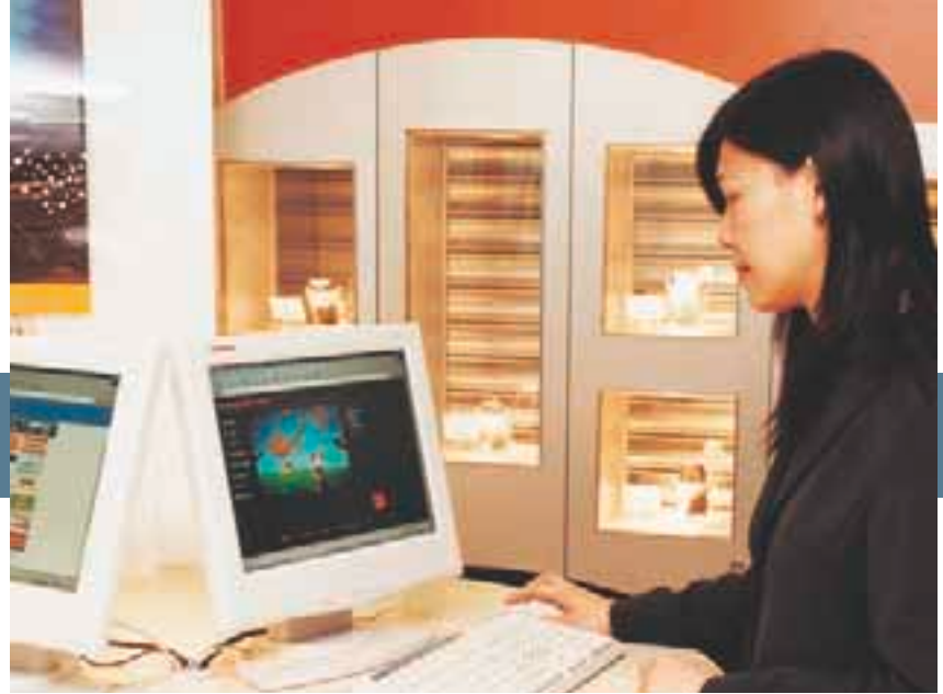
和記電訊澳門專門店特設資訊專站，客戶可瀏覽互聯網及查閱最新產品及服務。