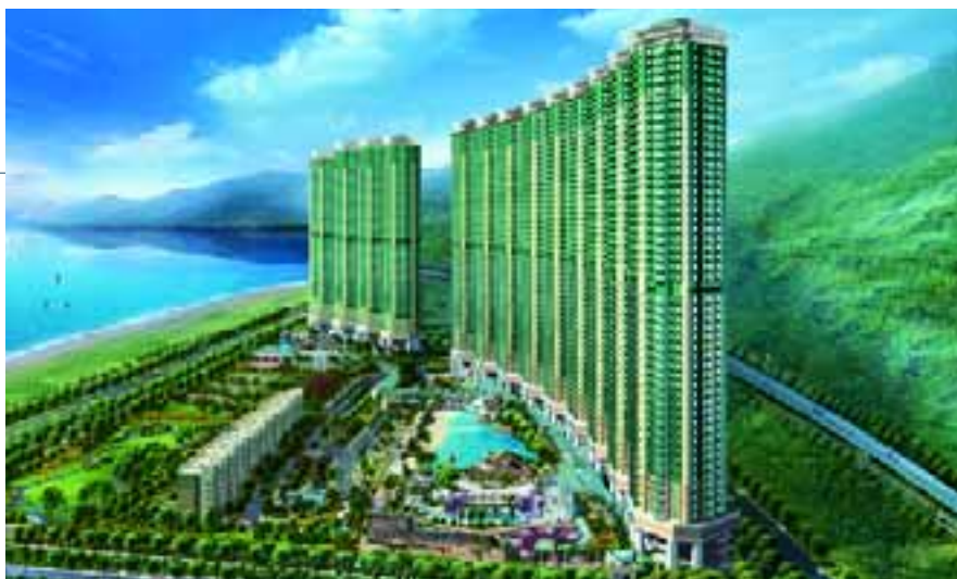
映灣園位於環境優美的東涌新市鎮，鄰近赤鱗角的香港國際機場。