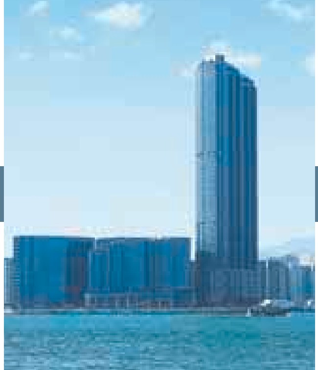
位於紅磡海旁之海名軒樓高七十二層，是香港現時最高的臨海住宅大廈，氣勢非凡。

由於發展項目落成日期安排關係，集團於二〇〇一年度並無重大之地產發展溢利。東涌映灣園第一期於本年度開始預售。該物業是一個分期發展之商住項目，樓面面積達四百四十萬平方呎。集團持有該項目之合資權益，並有攤佔溢利之安排。該項目施工如期進行，預計將於二〇〇二年至二〇〇五年分期完成。集團基於審慎原則，已為該項目作出撥備。