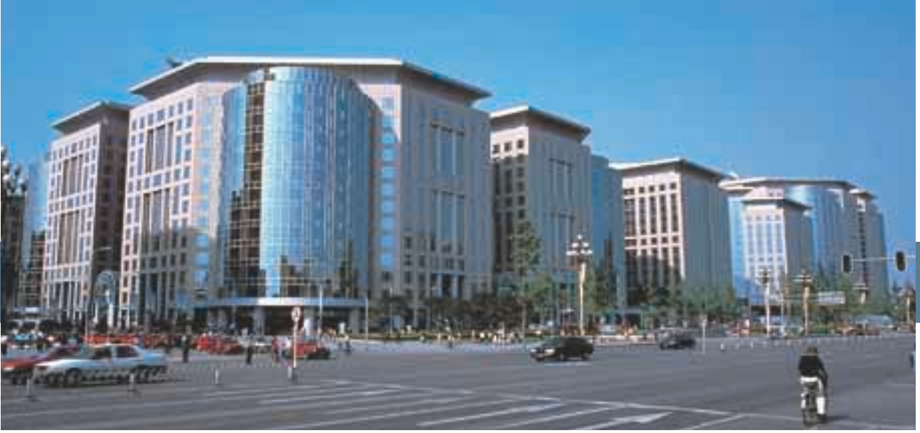
東方廣場位於北京的中心地帶，是亞洲最大型的商業發展項目。

集團在中國內地之酒店業務雖然因其中兩間酒店錄得開辦業務虧損及競爭持續激烈而整體上錄得虧損，但與上年度相比則有所改善。北京海逸酒店（集團佔百分之九十五權益）房租增加；北京長城喜來登飯店（集團佔百分之四十九點八權益）之業績隨客房裝修工程完成而獲得改善；重慶海逸酒店（集團佔半數權益）入住率上升；昆明海逸酒店（集團佔百分之九十五權益）更在入住率及房租兩方面皆有改進。另外，瀋陽時代酒店（集團佔百分之八十七點四權益）已於本年度六月啟業，提供二百七十四間中價客房；而位於北京東方廣場（集團佔百分之十八權益）之北京東方君悅大酒店亦緊接於同年十月開業，提供五百九十一間豪華客房及二百七十七間服務式套房。