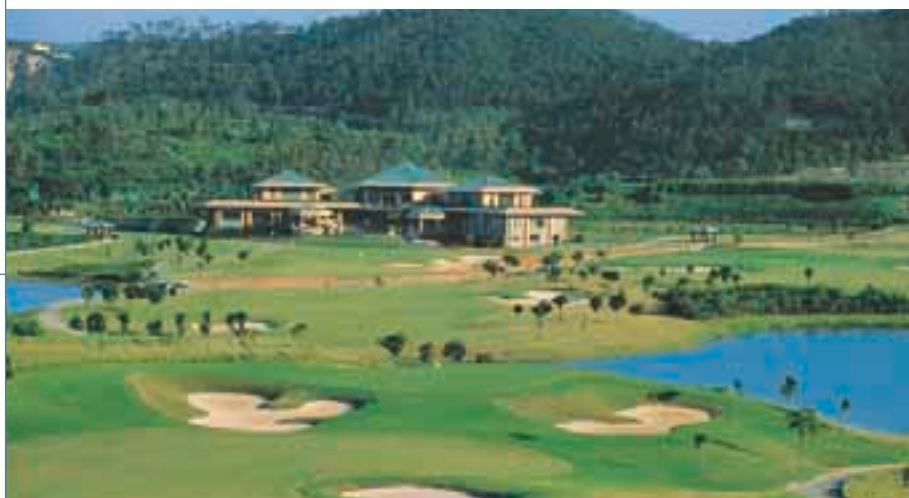
東莞海逸高爾夫球會擁有二十七個洞的冠軍級球場，面積達一千四百萬平方呎。

在東莞，集團於設有二十七個洞之海逸高爾夫球會持有百分之四十二權益，同時亦在毗鄰一個三百四十萬平方呎之豪華住宅發展項目持有百分之四十七點三權益。該項目位於厚街附近，分數期發展，第二期已命名為「海逸豪庭倚湖名居」，樓面面積達八十六萬四千平方呎，預計於二〇〇三年落成。有關之單位最近已開始預售。