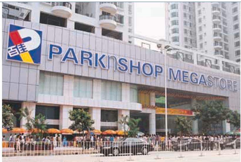
百佳成功在華南地區引進大型購物廣場的新概念。

集團之非食品零售業務包括屈臣氏大藥房及Savers。屈臣氏大藥房是首屈一指之個人護理產品連鎖店，在香港、台灣、中國內地及東南亞各國享負盛名；Savers則是英國一家保健及美容產品連鎖店。此等業務之合計銷售額較上年度增加百分之十四，利息及稅前盈利則與上年度相若。屈臣氏大藥房在亞洲繼續擴充，商店數目在本年度增加二十八間，使區內總數達到超過五百六十間。在香港，屈臣氏大藥房之總銷售量輕微上升，但由於經濟不景，利息及稅前盈利低於上一年度。內地之銷售量增加百分之十五，並錄得良好業績。台灣方面因當地經濟放緩，新台幣匯率下調及經營遇到阻滯而錄得較上年度減少百分之十五之銷售量，利息及稅前盈利亦大幅下降。該公司新上任之管理層正著手處理上述困難，重整旗鼓，務求改善業績。在東南亞，屈臣氏大藥房於新加坡、馬來西亞及泰國之銷售量較上年度增加百分之三，利息及稅前盈利亦有上升。集團於二〇〇〇年九月收購之英國Savers連鎖店在本年度積極增設商店，至年底為止，商店數目已增至超過二百三十間。由於成功增加商店，加上各店之銷售量大幅上升，Savers本年度錄得大幅增長，業績較預期為佳。該公司已積極部署下一步之擴展計劃。