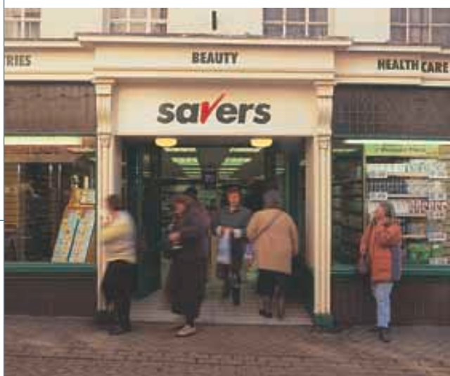
Savers 保健及美容產品連鎖店在英國繼續錄得迅速增長，提供物超所值的產品，方便顧客選購。

集團在內地之主要投資包括持有寶潔-和記有限公司百分之二十權益。該合資公司生產及分銷一系列美髮品、護膚品、香皂、清潔劑、牙齒護理及紙類產品，銷售點遍及全國。由於該公司本年度有一次過之企業重組支出，又於年內面對本地及國際投資者之激烈競爭，因此對集團之利息及稅前盈利貢獻較上年度減少。