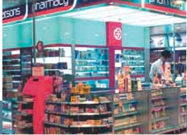
屈臣氏個人護理商店始終是亞洲最著名的保健及美容產品零售店。