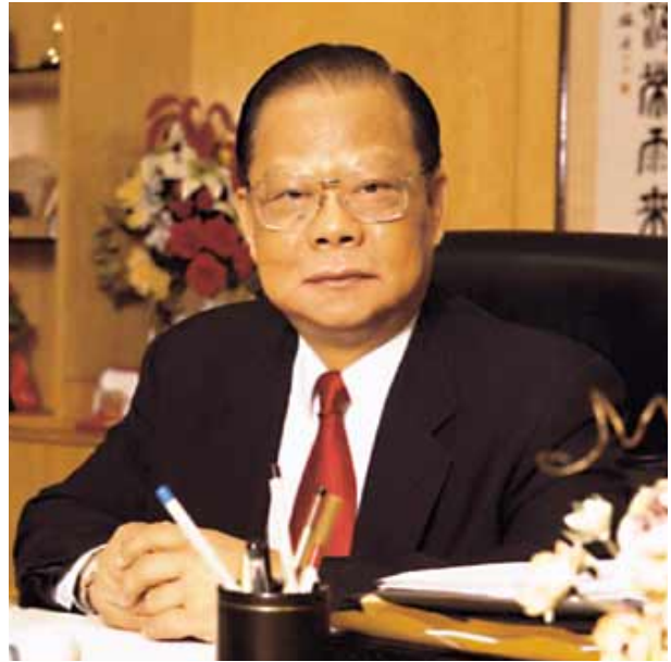
本集團主席 曾憲梓博士 大紫荊勳賢