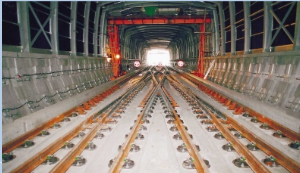
西鐵北區路軌工程