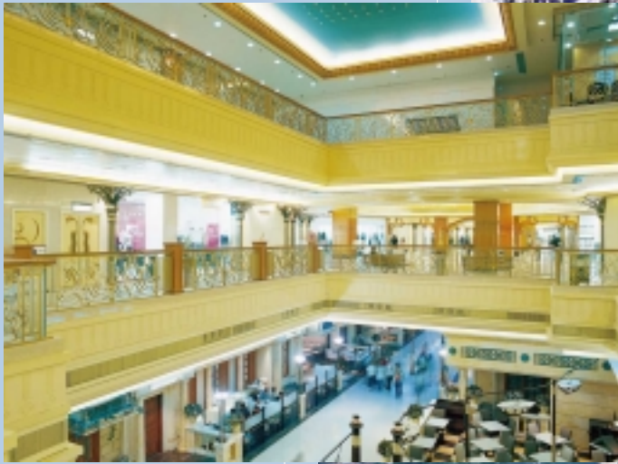
杏花邨商場裝修工程