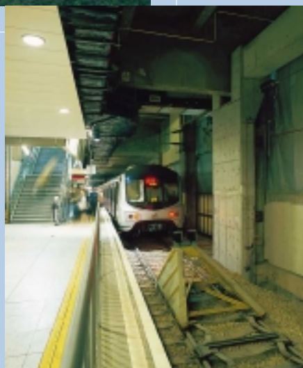
紅磡火車站改建工程