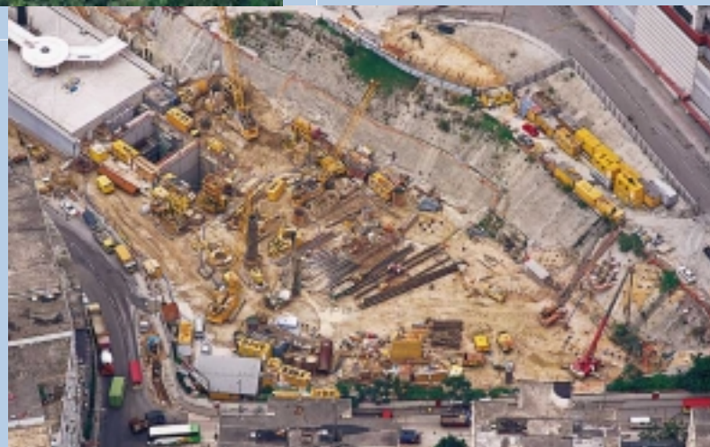
將軍澳支綫五桂山隧道打樁工程