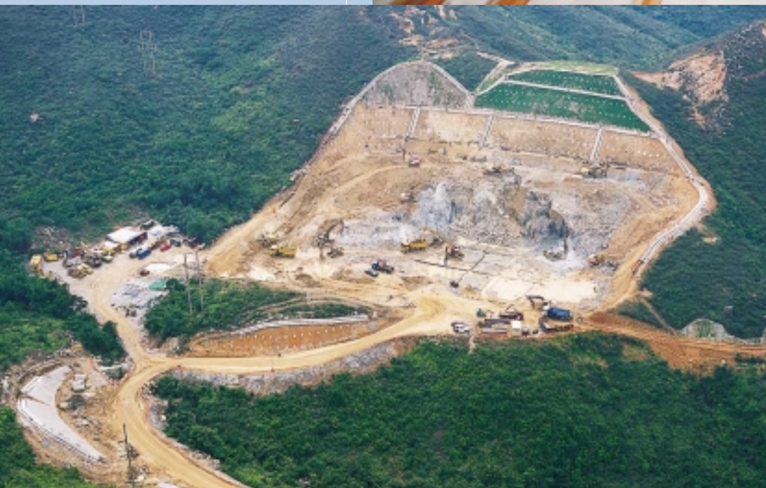
陰澳篤食水配水庫建築工程