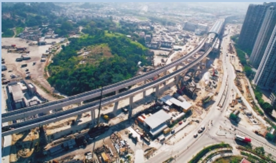
西鐵第一期工程 — 錦田至天水圍之 架空鐵路建築工程