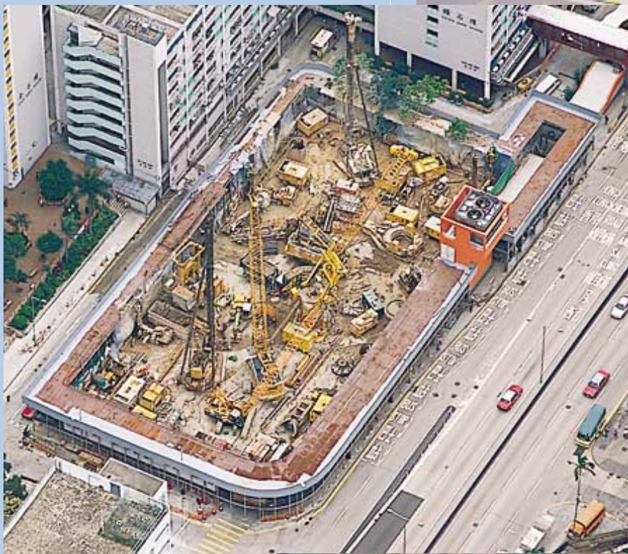
彩虹站泊車轉乘公共交通工具物業發展