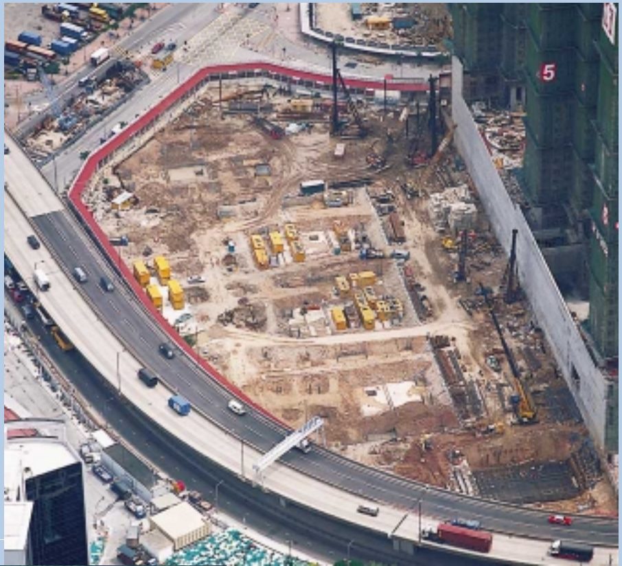
新九龍內地段6275號西九龍填海區住宅發展之地基工程