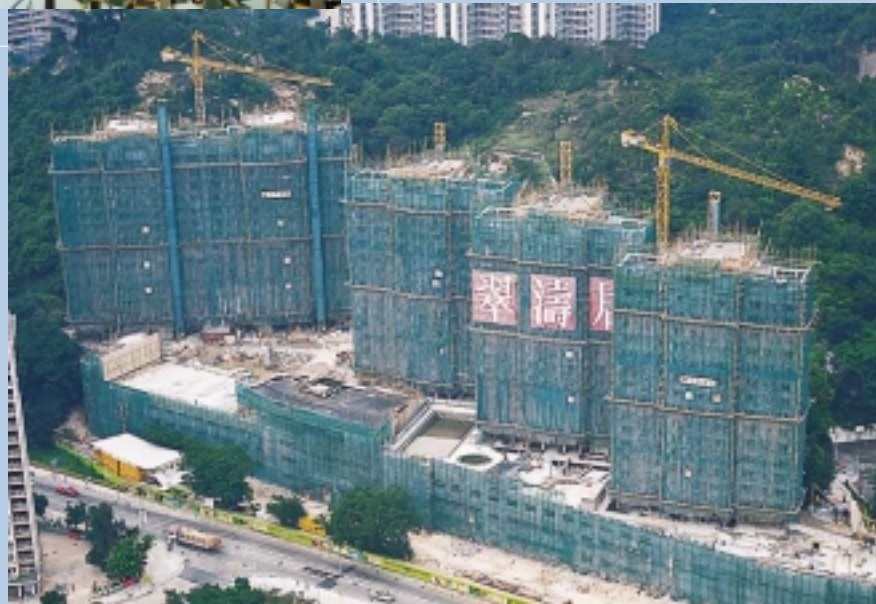
屯門市地段386號 住宅大廈建築工程