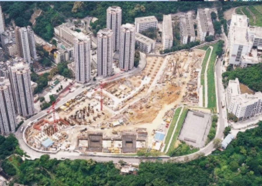
石排灣邨第一期重建計劃地基工程