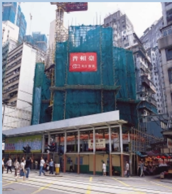
香港德輔道西80-90號重建工程