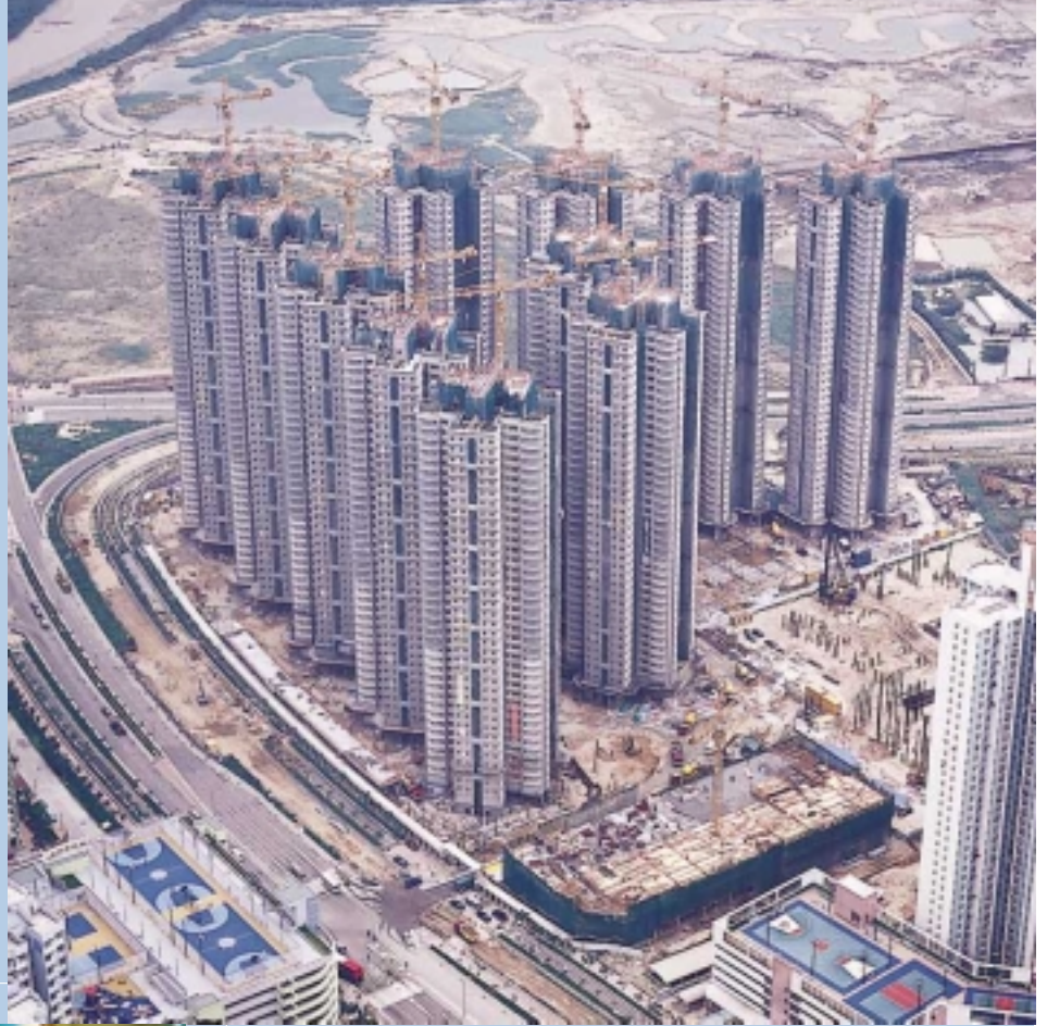
天水圍私人機構參建居屋計劃