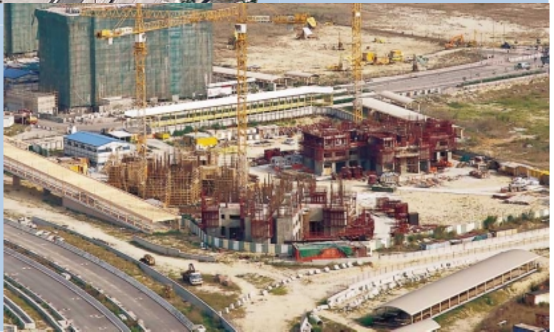
元朗天水圍市地段27號 住宅大廈建築工程