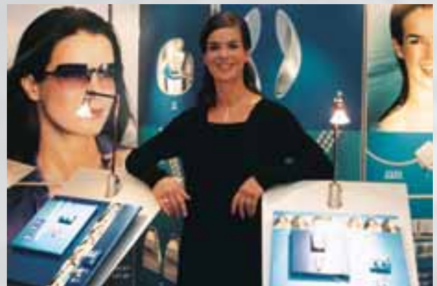
Katarina Witt 於二零零一年柏林展示其「feelings Katarina Witt」銀器首飾系列