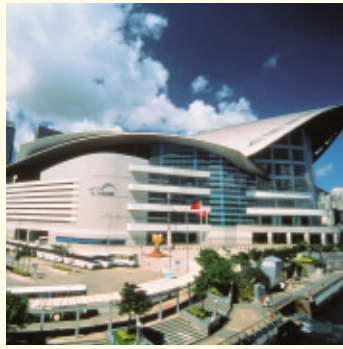
4 香港會議展覽中心