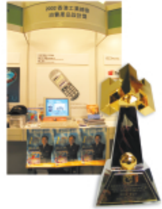
2002 香港工業總會消費產品設計獎

本集團擁有 32% 權益之創業板上市科技投資九方科技控股有限公司（「九方」）憑著其新開發之九方文字輸入系統英文版，再次榮獲二零零二年香港工業總會消費產品設計大獎。九方已與職業訓練局訂立協議，將九方中文輸入法列為香港僱主認可技能之一。包括香港諾基亞有限公司等之多間流動電話製造商已於二零零二年九月起開始生產配備九方輸入法之電話。九方將向該等電話製造商收取特許費用。在山東省，九方文字輸入系統更被列為中小學之教學工具。