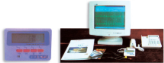
微型智能心電監護系統—生命卡

本集團於上一財政年度末初次投資於生物科技公司後，亦進一步投資於以下醫藥保健範疇：(i) 為北京醫科大學之研發項目提供商業贊助，研究減低血液脂肪水平及提升運動員表現之運動及糖尿病飲料。研究仍處於起步階段，預期將須進行三年研究，製成品方可作商品銷售；(ii) 於亞洲分銷一套保健系統，利用已取得專利之超幼細納米微粒噴霧療法，將水溶性之保健物質（例如礦物質、維他命）滲透入人體各個細胞，使每個細胞均充滿生機，減慢衰老過程。進入中國市場之計劃現正進行中。