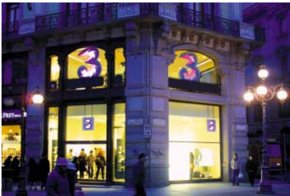
雖已是夜幕低垂，米蘭市中心的3商店仍在為顧客服務。

集團在世界各地之3G業務合作無間，協力設計及建設網絡及支援性軟件基建設施，務求在採購方面取得經濟規模效益，同時分享技術與資源。集團並已制訂共同策略，進行收購及開發資訊科技與內容之工作。在此方針下，各地3G業務得以透過集體採購節省成本，同時亦能取得其他相關利益，包括加強同業間之策略夥伴關係。此外，集團對3G資本開支需要、營運方式及成本進行了全面檢討，預算將截至二〇〇五年之最高資金要求調低約四十億歐羅（港幣三百一十億元）。於今年年底，3G業務將已支出近百分之百之牌照成本，而資本性開支需要預期會支出約七成，大致完成3G電訊之投資期。英國及意