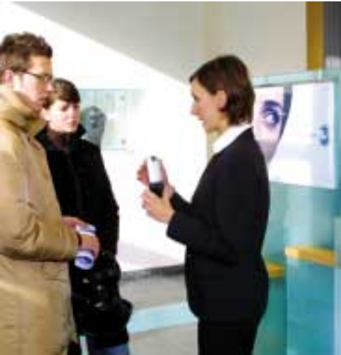
米蘭3商店的營業員向顧客介紹3G的優點。

大利3G業務之最高資金要求主要由現有無追索權或有限追索權之銀團貸款以及設備供應商對等貸款支付。集團預期，3G業務在開辦階段仍須提供某程度上之財務支援，並擁有大量資金以配合所需。隨著3G業務於二〇〇三年由發展階段進入運作階段，集團有信心此項新一代之優質多媒體電訊業務，可憑藉其精彩之內容及應用方案，成功吸引消費者。集團在英國、意大利、瑞典、丹麥與奧地利之3G業務，以及泰國CDMA-1X業務於二〇〇二年處於開辦前投資期，有關之開辦支出港幣十八億七千一百萬元已計入損益賬，並已提撥往年所作之備付金償付。