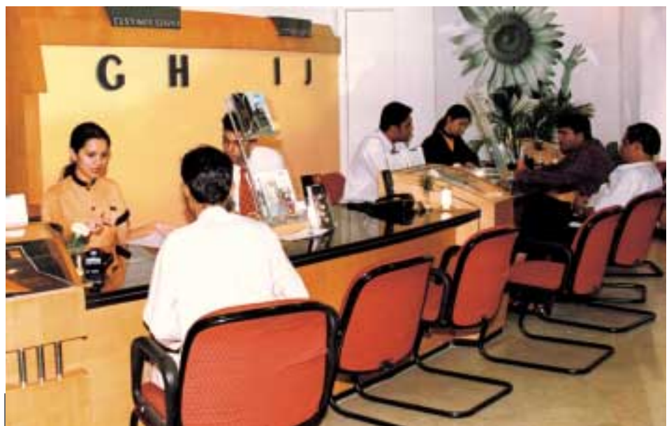
印度孟買的客户基礎日益擴張，因此特別設立Orange商店，提供優質的客户服務。

在印度，集團擁有七項2G電訊業務約百分之四十九權益，包括位於孟買之Hutchison Max Telecom、德里之Hutchison Essar Telecom(前稱Sterling Cellular)、加爾各答之Hutchison Telecom East(前稱Usha Martin Telekom)、古吉拉特邦之Fascel以及三項分別位於卡納塔克邦、安得拉邦及清奈市之新辦業務，該三項新業務已於二〇〇二年六月推出GSM網絡服務。孟買、德里、加爾各答及古吉拉特邦四項原有業務之「利息及稅前盈利」錄得增長，