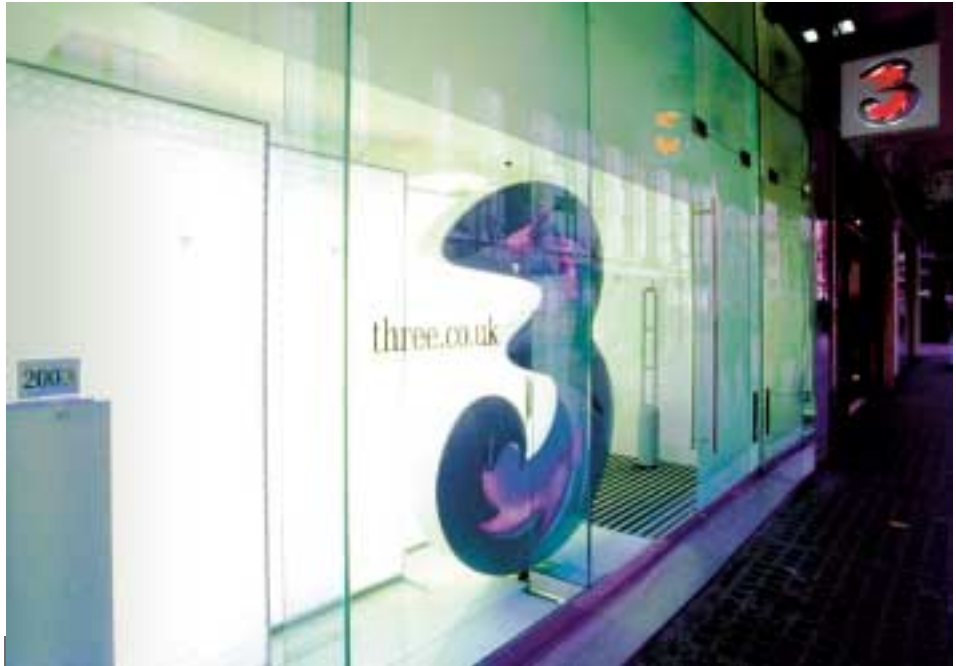
英國的3旗艦店提供嶄新的3G手機與服務。