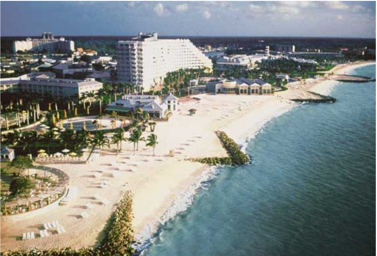
Our Lucaya高爾夫球度假酒店面向大巴哈馬島的海灘，是各地遊客的度假天堂。

位於大巴哈馬島之Our Lucaya高爾夫球度假酒店設有一千二百七十一間客房，繼續受旅客人數下降影響，其中美國旅客人數之減幅尤其顯著。今年較早前，此度假酒店由世界知名之美國Starwood Hotels & Resorts集團接手管理。