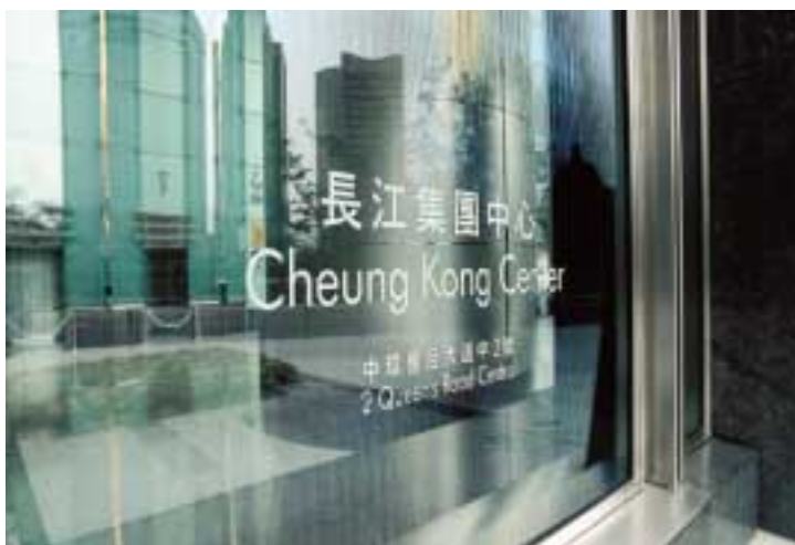
除長江實業(集團)有限公司之總部外，長江中心的租戶包括多間世界知名銀行、金融機構，會計及律師事務所。