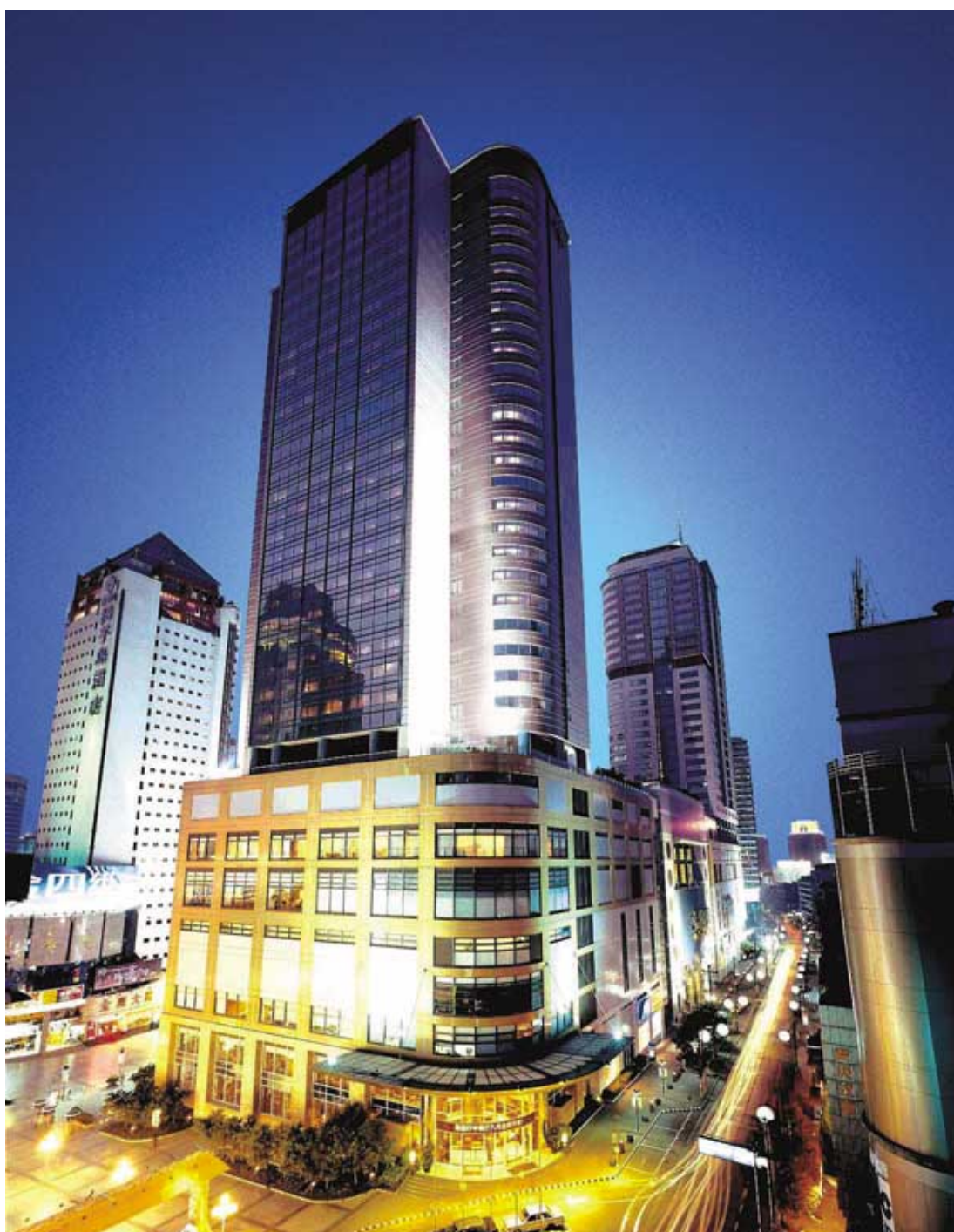
重慶大都會廣場內有大型購物商場、甲級辦公樓及五星級酒店。