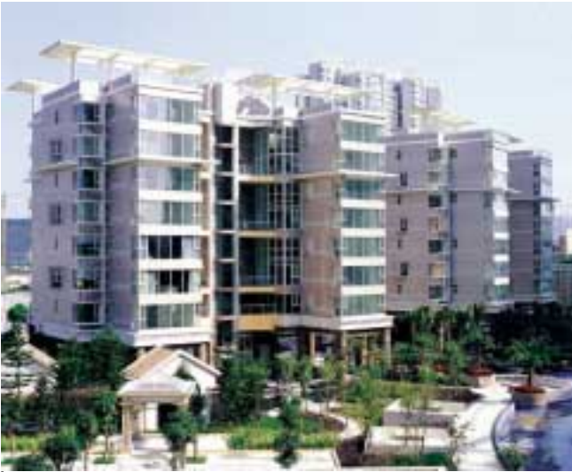
位於深圳市中心區的黃埔雅苑二期逸悠園，外型設計獨特，甚富時代感。