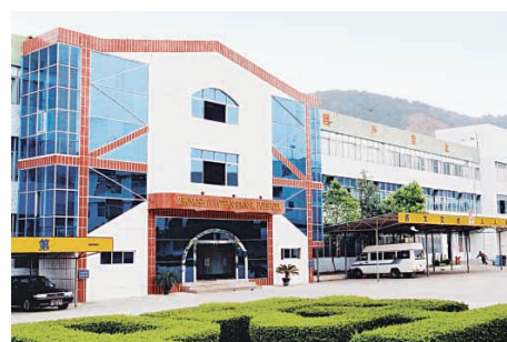
中山國際玩具有限公司

董事會已決定建議向二〇〇三年五月十九日登記在本公司股東名冊內之股東，派發二〇〇二年末期股息每股港幣1.5仙(二〇〇一年：每股港幣1.5仙)。擬派股息將於獲股東週年大會批准後，於二〇〇三年五月二十日派付。