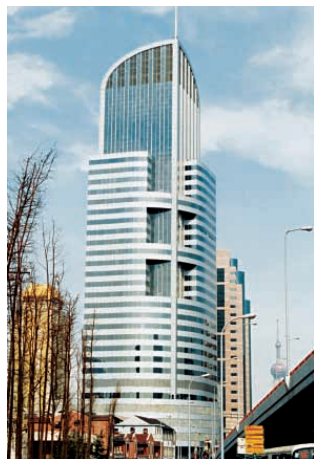
位於上海之港陸廣場

本集團亦加強原設計製造業務，藉以繼續擴充業務範圍，進一步滿足客戶個別之需要，令產品更趨多元化。