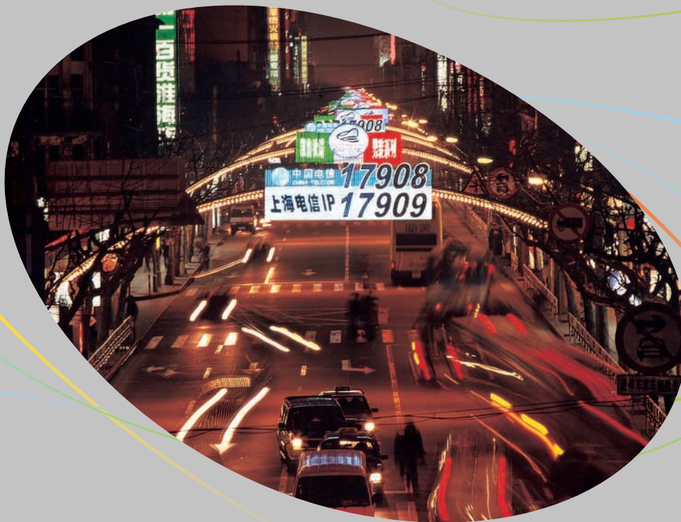
淮海路的「燈光隧道」，上海十大最佳夜景之一。