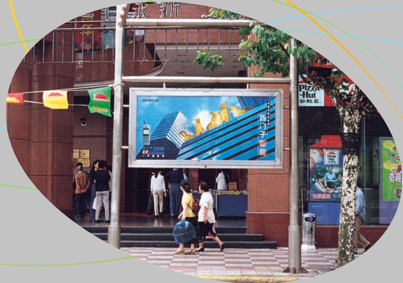
位於上海的廣告燈箱。