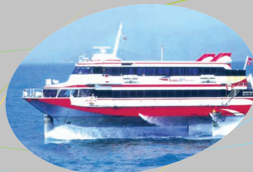
信德集團轄下的「噴射飛航」高速客運船隊。