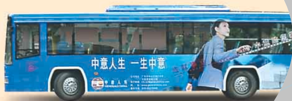
位於廣州全車身廣告巴士。