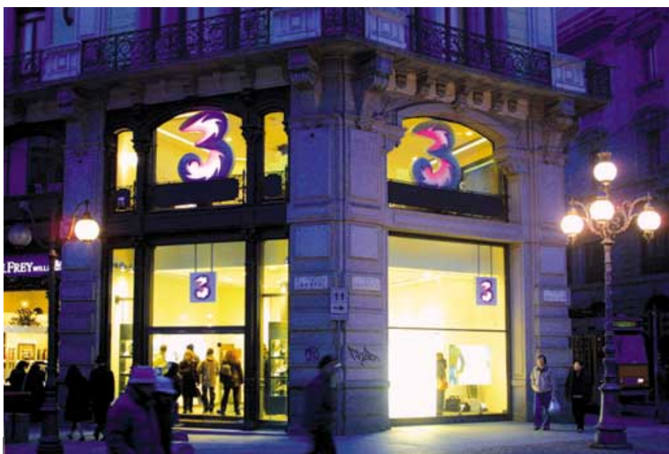
雖已是夜幕低垂，米蘭市中心的3商店仍在為顧客服務。

集團在世界各地之3G業務合作無間，協力設計及建設網絡及支援性軟件基建設施，務求在採購方面取得經濟規模效益，同時分享技術與資源。集團並已制訂共同策略，進行收購及開發資訊科技與內容之工作。在此方針下，各地3G業務得以透過集體採購節省成本，同時亦能取得其他相關利益，包括加強同業間之策略夥伴關係。此外，集團對3G資本開支需要、營運方式及成本進行了全面檢討，預算將截至二〇〇五年之最高資金要求調低約四十億歐羅（港幣三百一十億元）。於今年年底，3G業務將已支出近百分之百之牌照成本，而資本性開支需要預期會支出約七成，大致完成3G電訊之投資期。英國及意