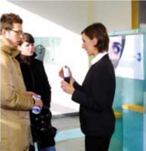
米蘭3商店的營業員向顧客介紹3G的優點。

大利3G業務之最高資金要求主要由現有無追索權或有限追索權之銀團貸款以及設備供應商對等貸款支付。集團預期，3G業務在開辦階段仍須提供某程度上之財務支援，並擁有大量資金以配合所需。隨著3G業務於二〇〇三年由發展階段進入運作階段，集團有信心此項新一代之優質多媒體電訊業務，可憑藉其精彩之內容及應用方案，成功吸引消費者。集團在英國、意大利、瑞典、丹麥與奧地利之3G業務，以及泰國CDMA-1X業務於二〇〇二年處於開辦前投資期，有關之開辦支出港幣十八億七千一百萬元已計入損益賬，並已提撥往年所作之備付金償付。