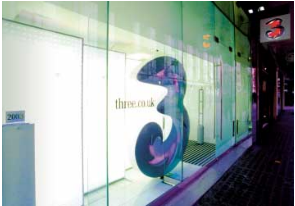
英國的3旗艦店提供嶄新的3G手機與服務。