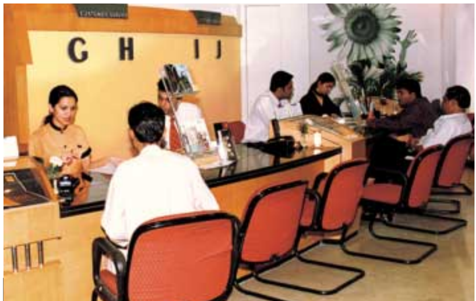
印度孟買的客户基礎日益擴張，因此特別設立Orange商店，提供優質的客户服務。

在印度，集團擁有七項2G電訊業務約百分之四十九權益，包括位於孟買之Hutchison Max Telecom、德里之Hutchison Essar Telecom(前稱Sterling Cellular)、加爾各答之Hutchison Telecom East(前稱Usha Martin Telekom)、古吉拉特邦之Fascel以及三項分別位於卡納塔克邦、安得拉邦及清奈市之新辦業務，該三項新業務已於二〇〇二年六月推出GSM網絡服務。孟買、德里、加爾各答及古吉拉特邦四項原有業務之「利息及稅前盈利」錄得增長，