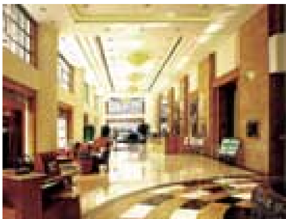
重慶海逸酒店於一九九八年六月開幕，為該市首間五星級酒店，共有三百九十一間客房。