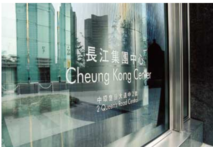
除長江實業(集團)有限公司之總部外，長江中心的租戶包括多間世界知名銀行、金融機構，會計及律師事務所。