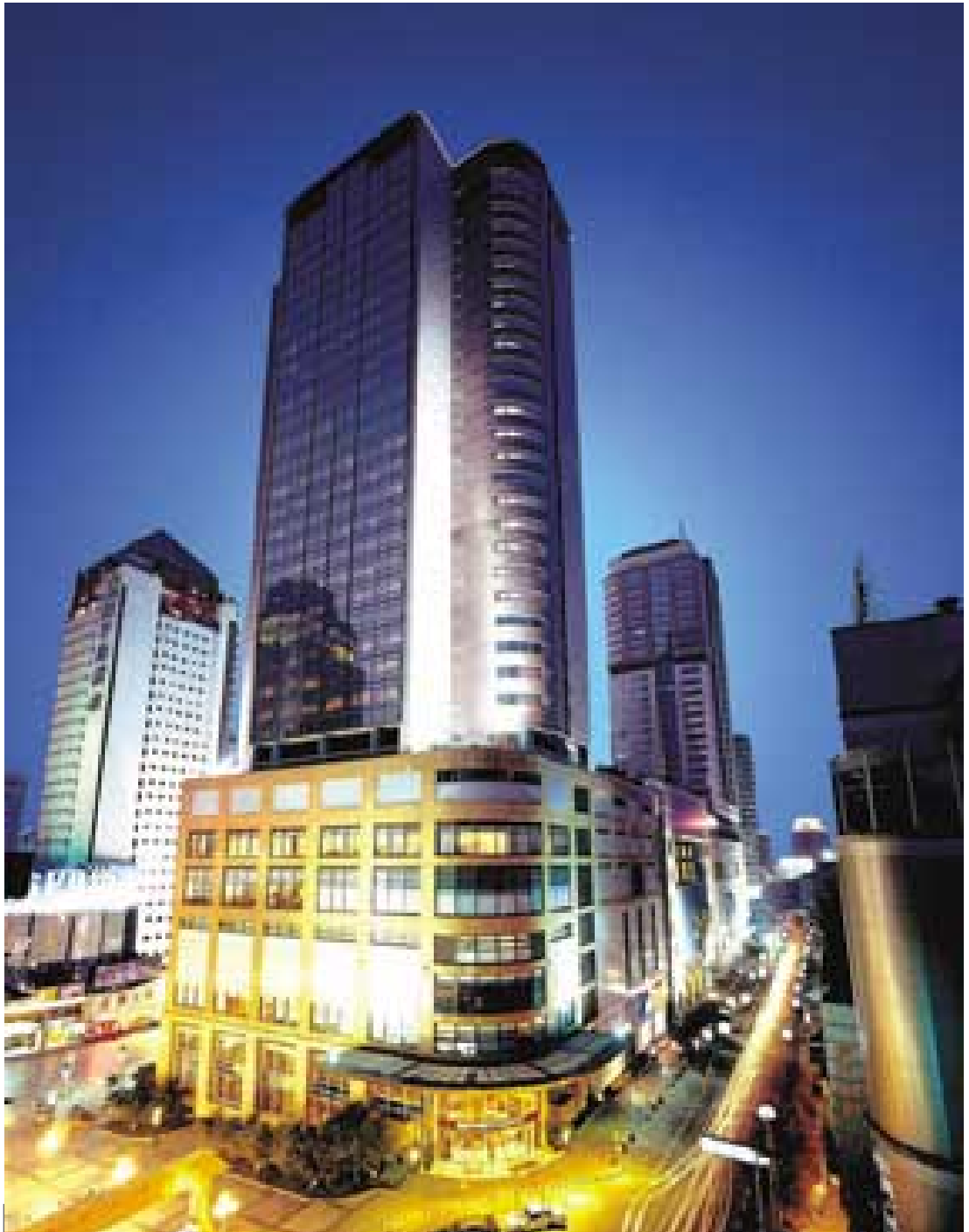
重慶大都會廣場內有大型購物商場、甲級辦公樓及五星級酒店。