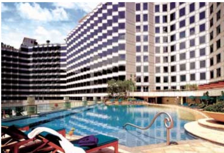
集團最近開業的都會海逸酒店位於紅磡火車站毗鄰，交通方便。