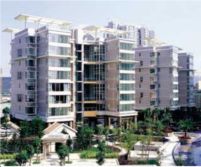
位於深圳市中心區的黃埔雅苑二期逸悠園，外型設計獨特，甚富時代感。