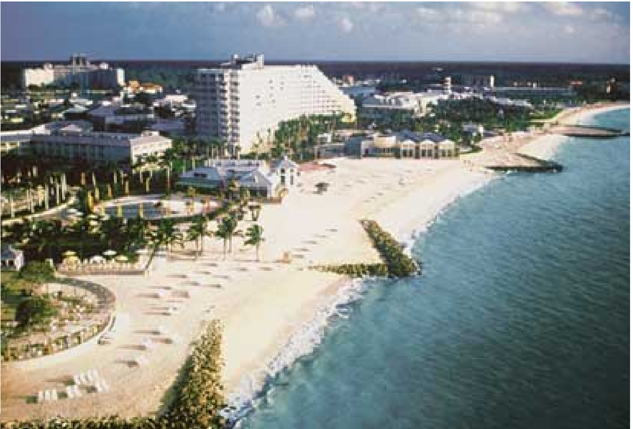
Our Lucaya高爾夫球度假酒店面向大巴哈馬島的海灘，是各地遊客的度假天堂。

位於大巴哈馬島之Our Lucaya高爾夫球度假酒店設有一千二百七十一間客房，繼續受旅客人數下降影響，其中美國旅客人數之減幅尤其顯著。今年較早前，此度假酒店由世界知名之美國Starwood Hotels & Resorts集團接手管理。