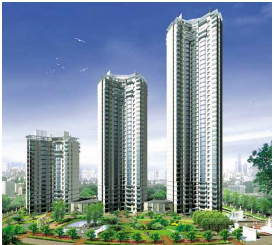
設計師筆下的滙賢居及四周園林。滙賢居是上海近年罕有的優質大型豪華住宅，總建築面積達六十七萬五千平方呎。

集團本年度上半年增加國內土地儲備，成立合資公司，在深圳寶安發展一項一百二十萬平方呎之住宅物業(佔百分之五十權益)。集團透過合資公司持有發展中的土地儲備，應佔之已發展面積約共一千六百萬平方呎，其中百分之二十一在香港、百分之七十二在國內及百分之七在海外。此等項目預期於二〇〇三至二〇〇九年分期完成，預料可為集團提供理想回報及發展溢利。