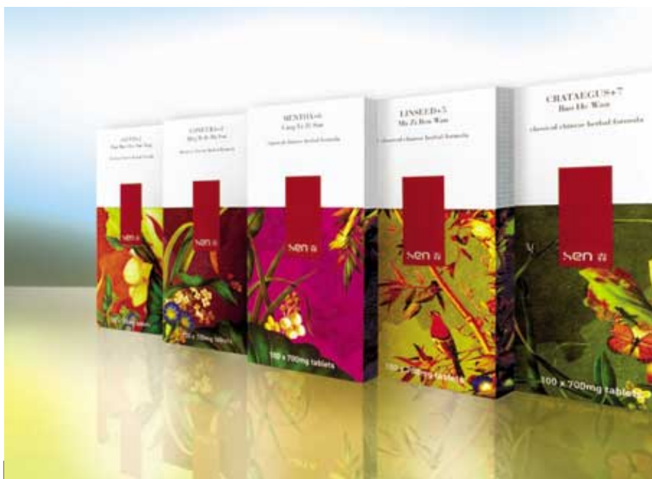
和黃在英國出售的Sen傳統中藥保健產品裝璜典雅，甚受西方顧客歡迎。

和黃中國繼續發展合資保健業務。其中之和黃健寶保健品有限公司總部設於廣州，在內地製造及分銷保健產品，集團佔百分之八十權益。此外上海和黃藥業有限公司在內地生產與分銷傳統中藥產品，集團佔百分之五十權益。於二〇〇二年十一月，集團在英國開設首間零售店，嘗試在當地推出「Sen」品牌之傳統中藥產品。