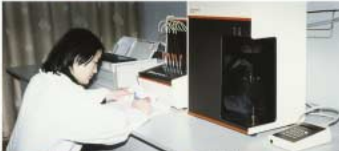
美國產 比表面 測試儀